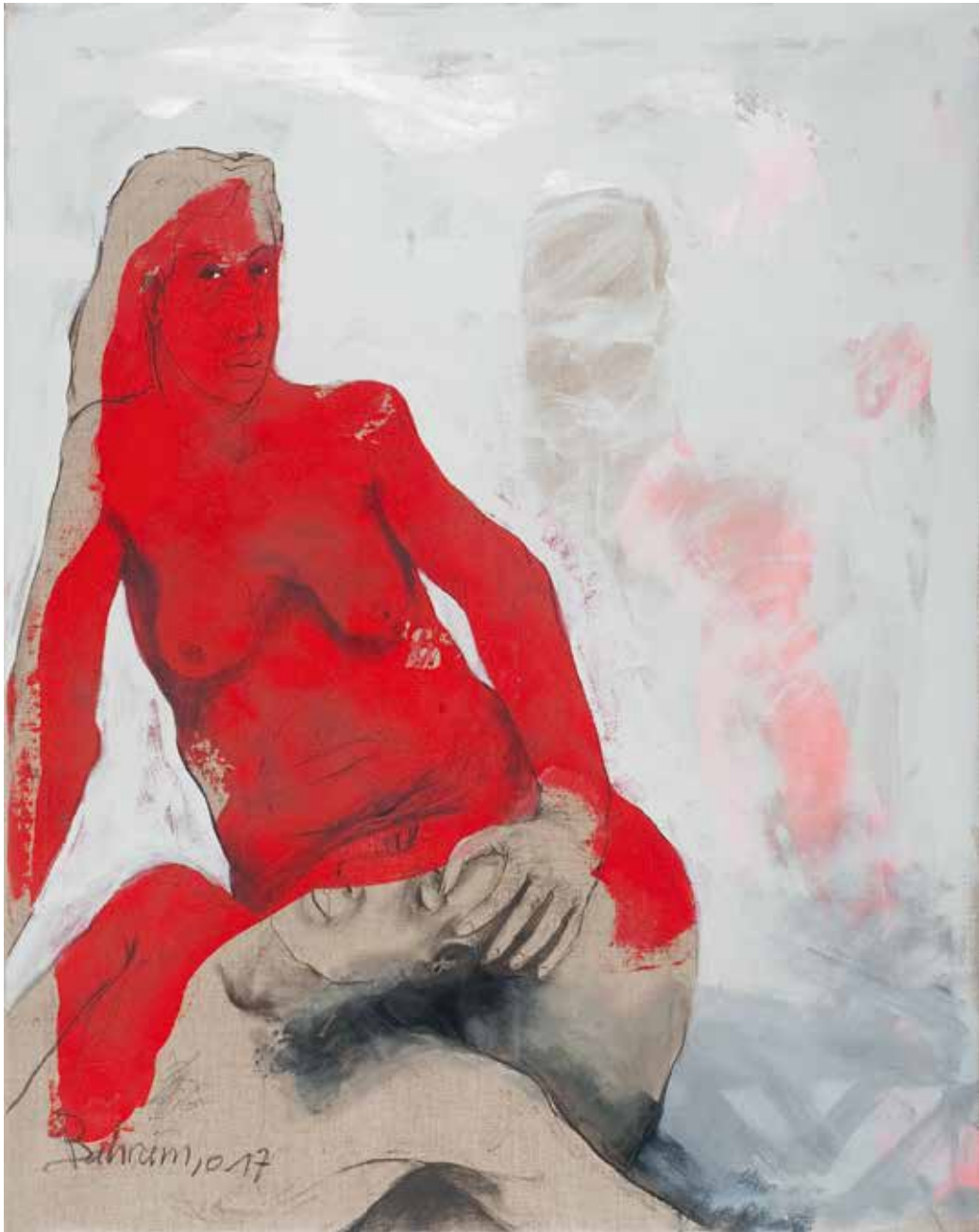
Paar | 2017 | Mixed Media/Canvas | 120 x 95 cm