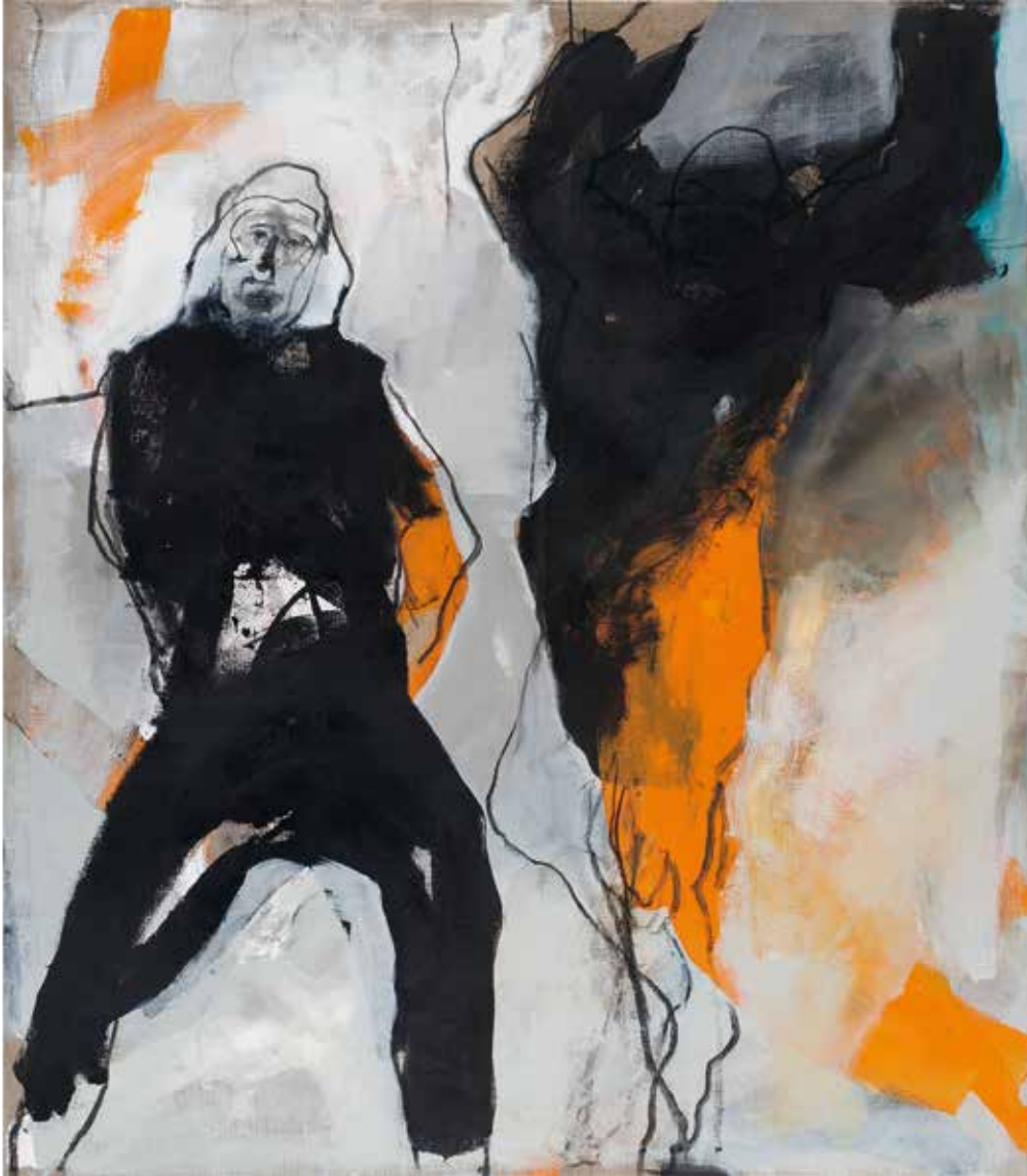
Kreuzigung II | Triptychon I | 2018 | Mixed Media/Canvas 13 x 160 x 140 cm (160 x 420 cm)