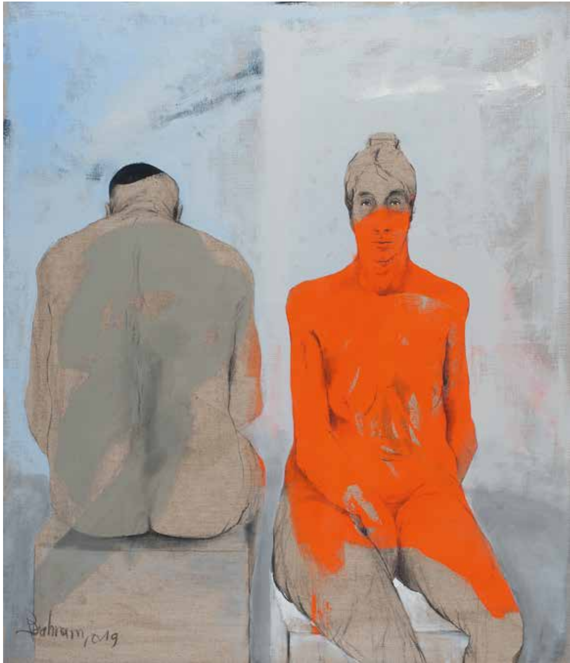
Ohne Worte | 2019 | Mixed Media/Canvas | 140 x 120 cm