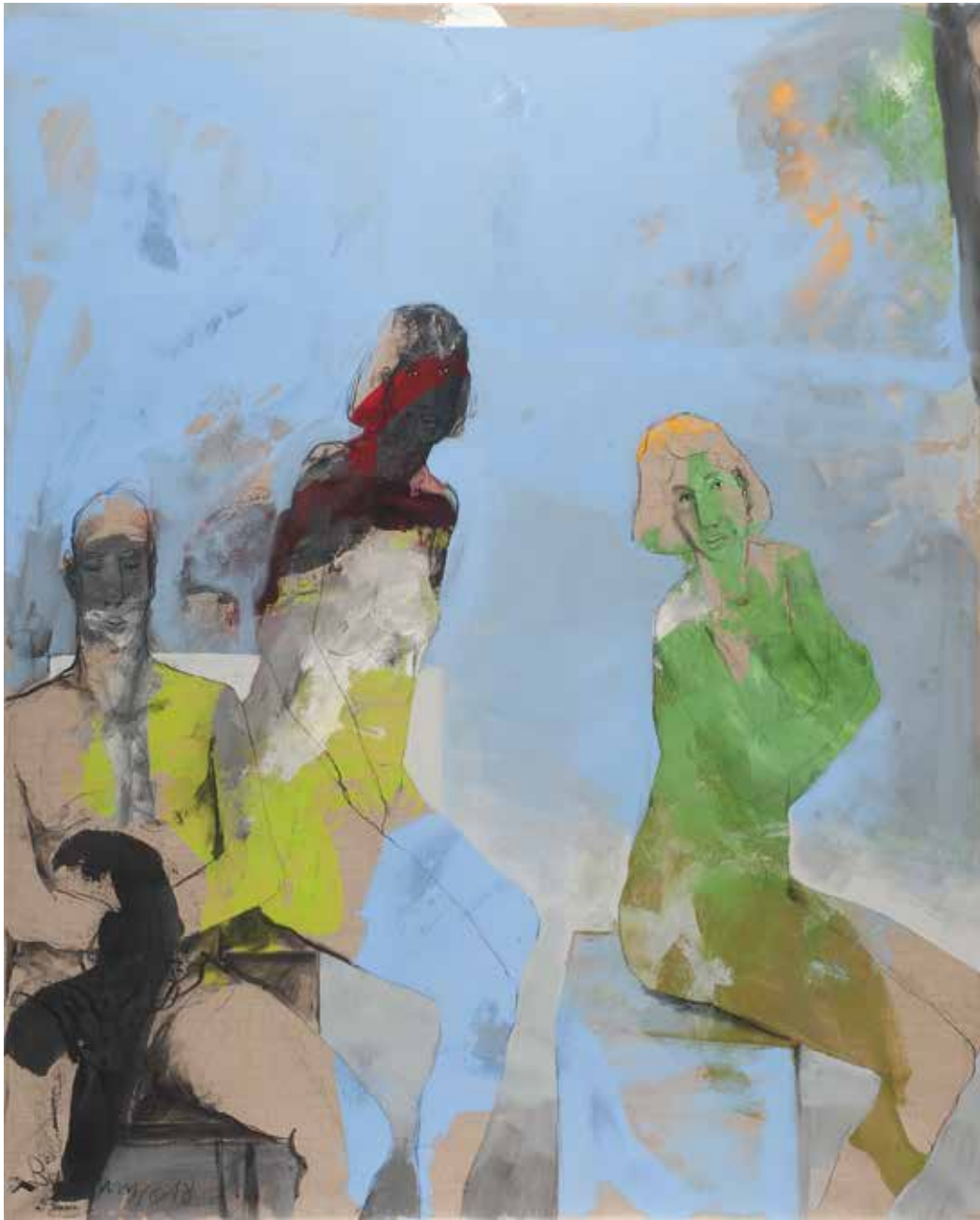
Ohne Titel | 2019 | Mixed Media/Canvas | 200 x 150 cm