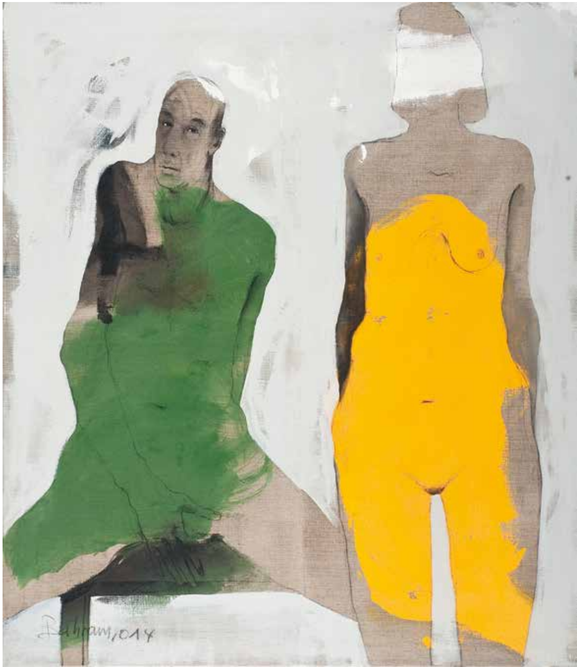
Paar | 2014 | Mixed Media/Canvas | 140 x 120 cm