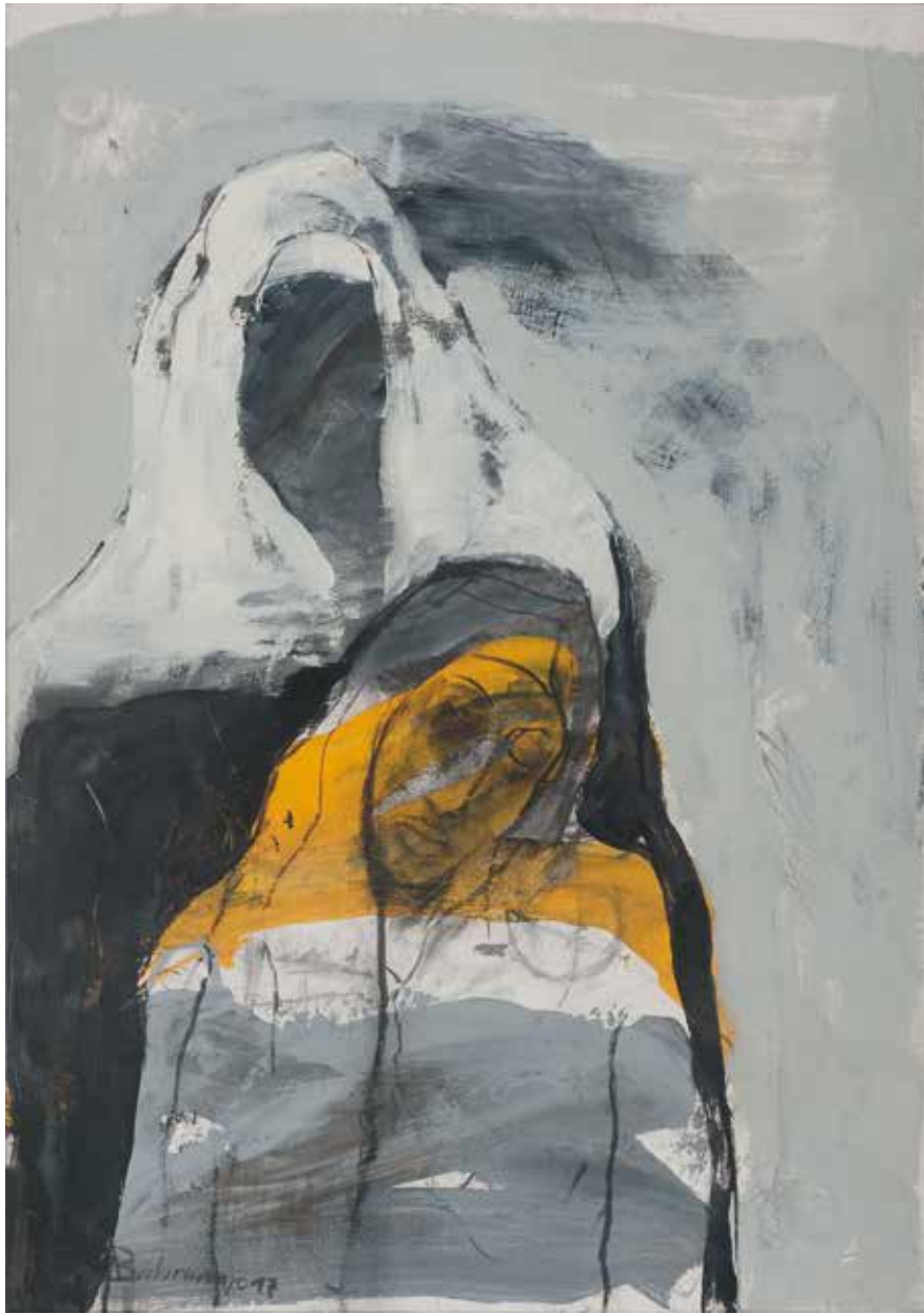
Ohne Titel | 2017 | Mixed Media/Fabriano | 100 x 70 cm