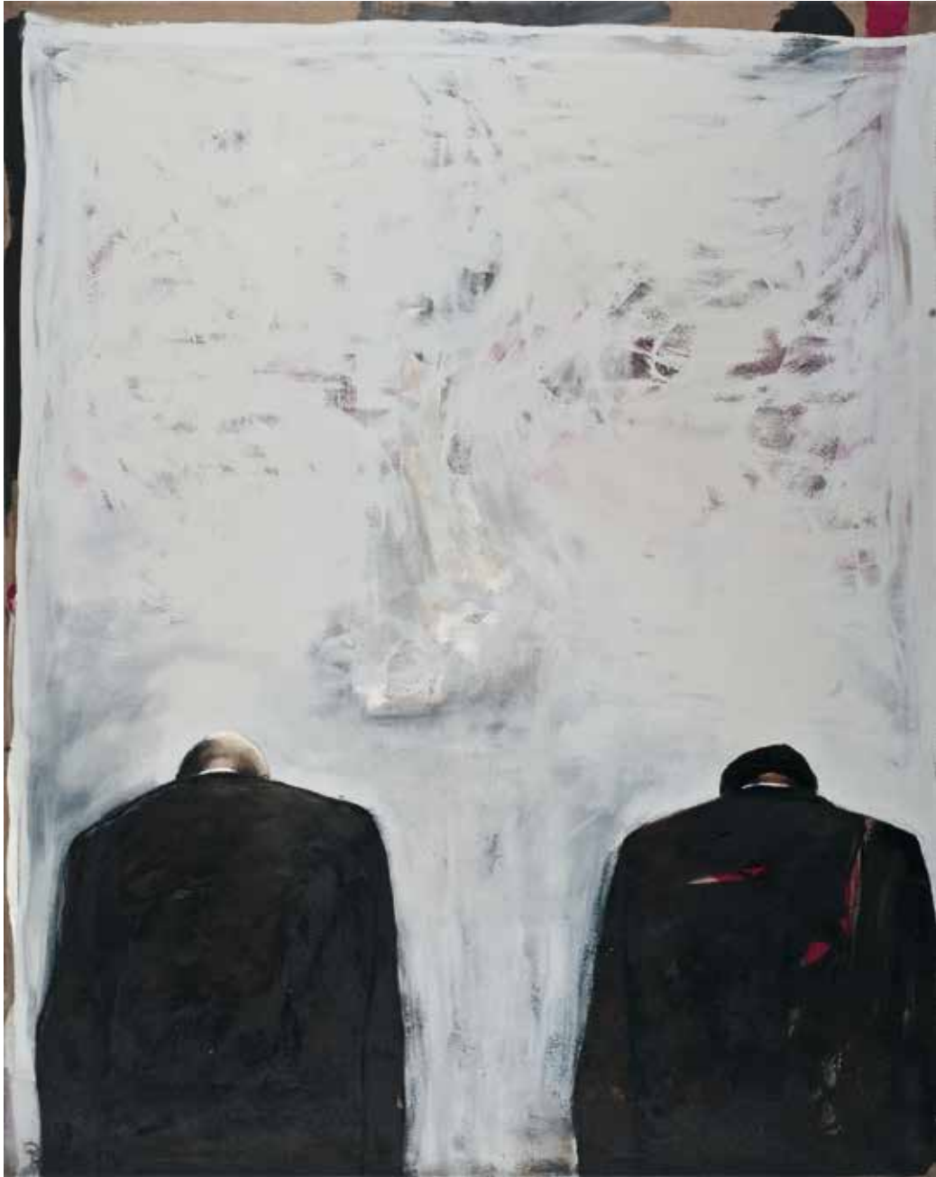
Ohne Titel | 2008 | Mixed Media/Canvas | 200 x 160 cm