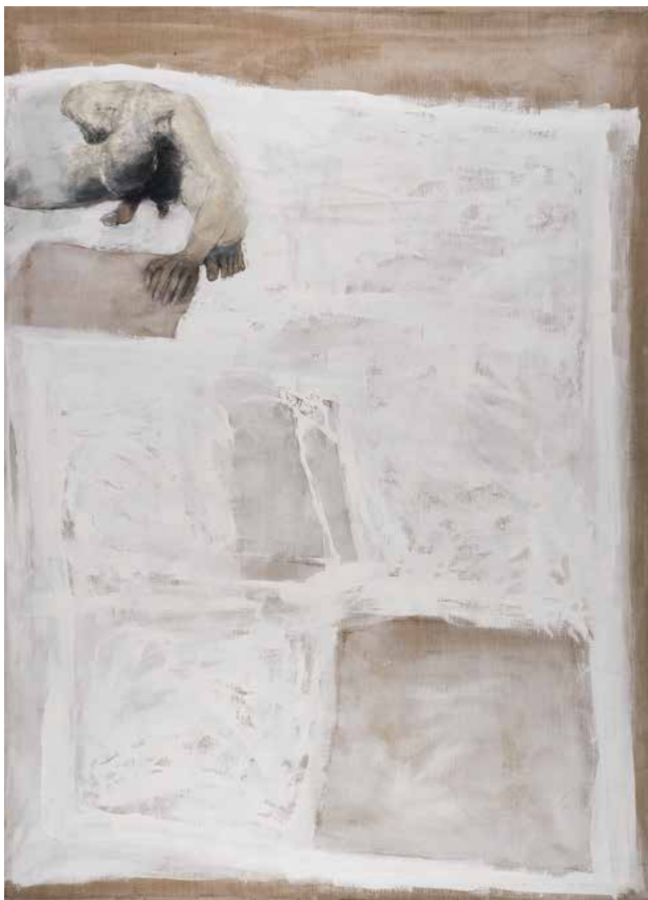
Ohne Titel | 2010 | Mixed Media/Canvas | 210 x 160 cm