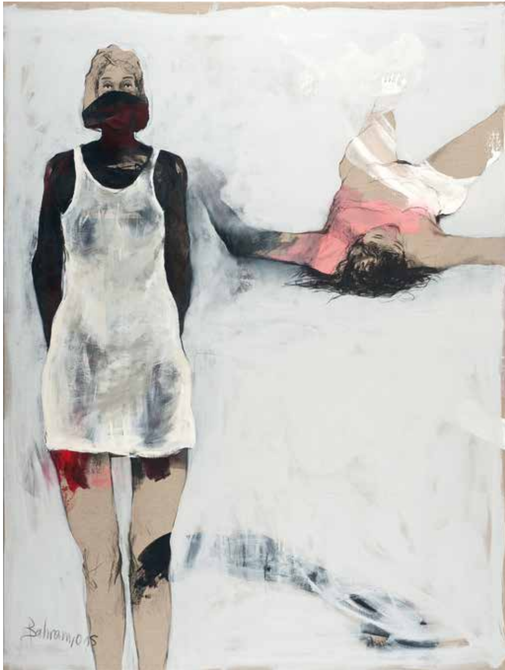
Ohne Titel | 2015 | Mixed Media/canvas | 210 x 150 cm