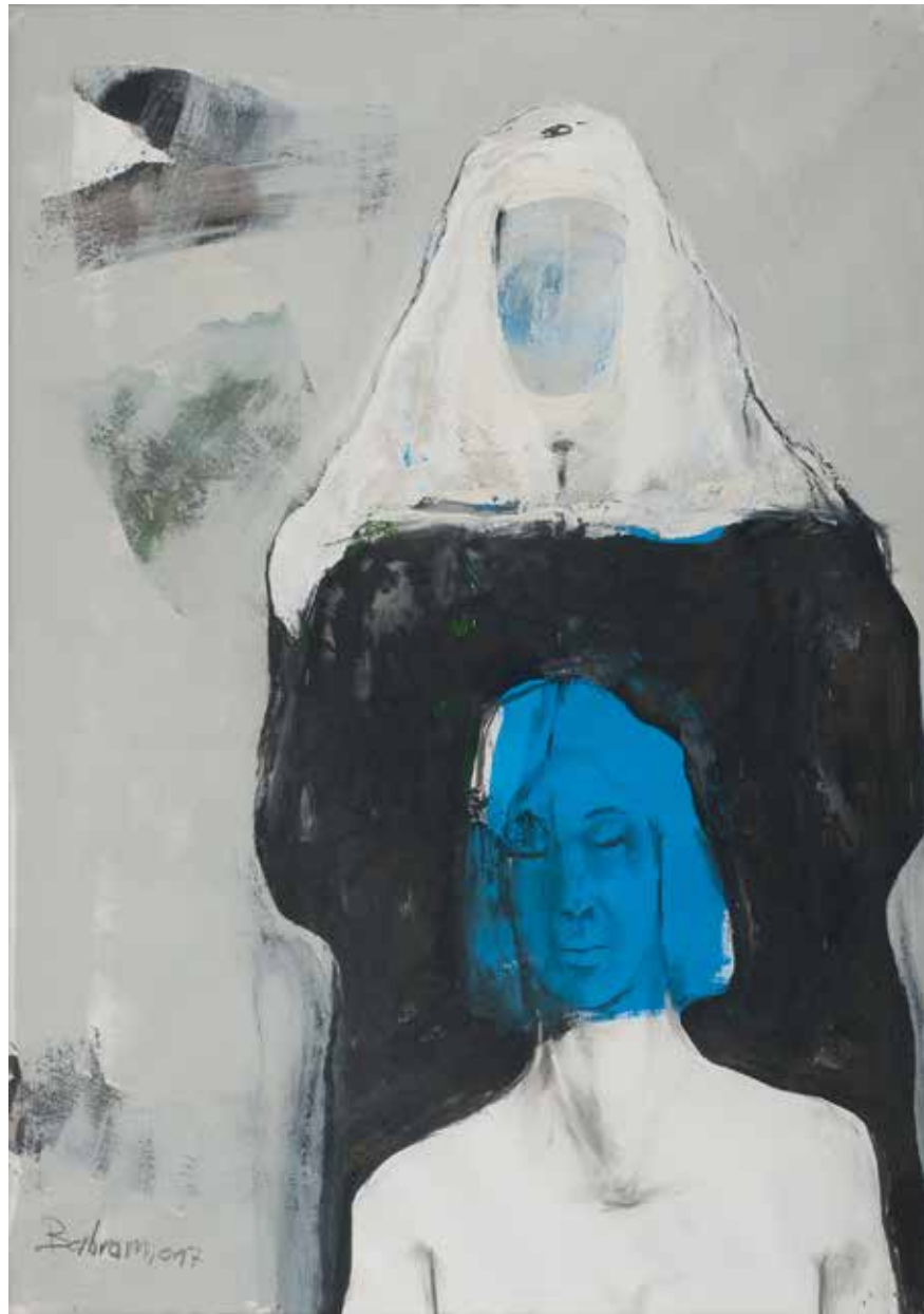
Ohne Titel | 2017 | Mixed Media/Fabriano | 100 x 70 cm