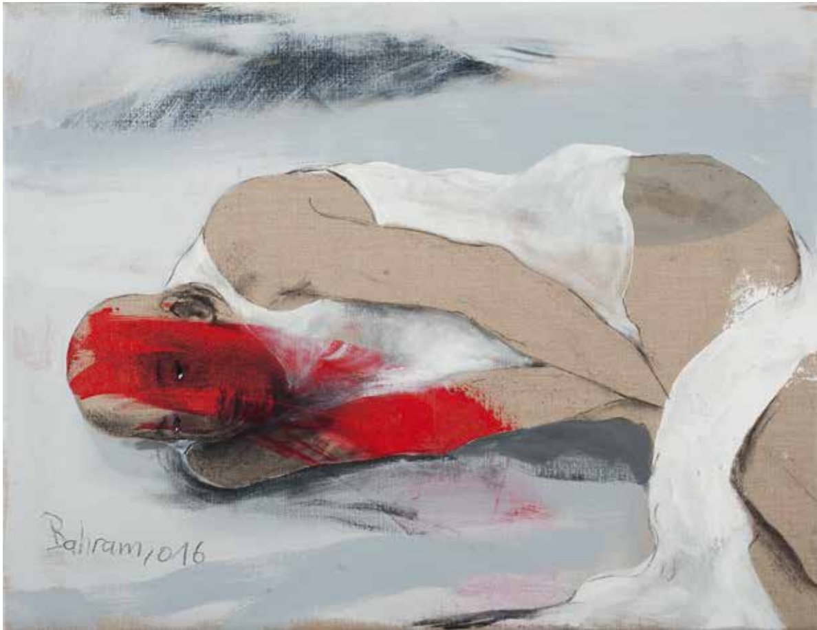
Ohne Titel | 2016 | Mixed Media/Canvas | 60 x 80 cm