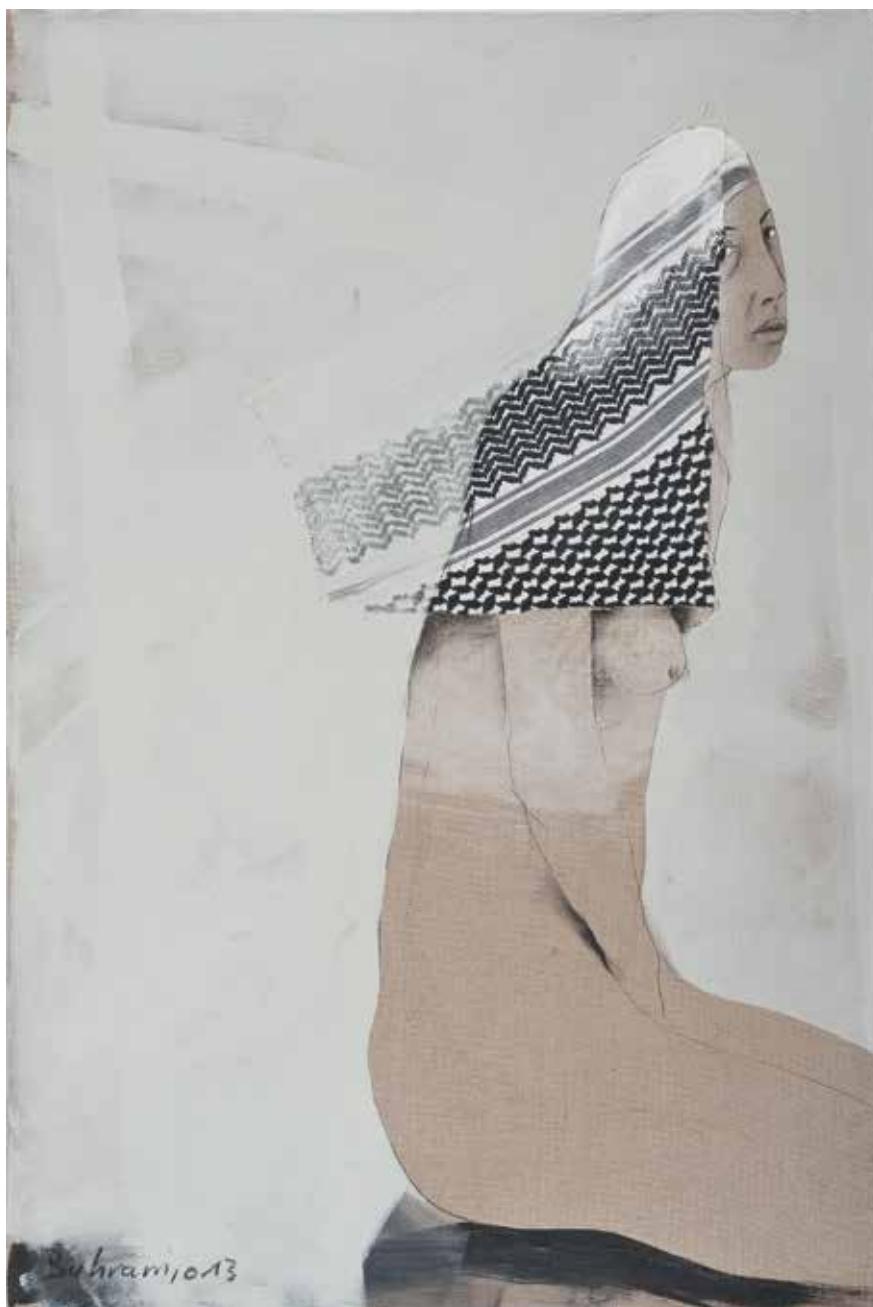
Frau | 2013/14 | Mixed Media/Canvas | 120 x 80 cm