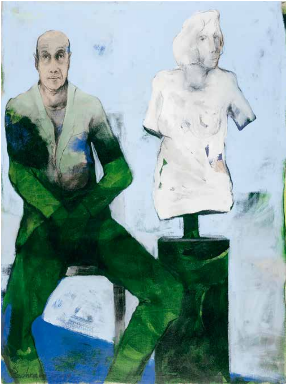
Ohne Titel | 2019 | Mixed Media/Canvas | 160 x 120 cm