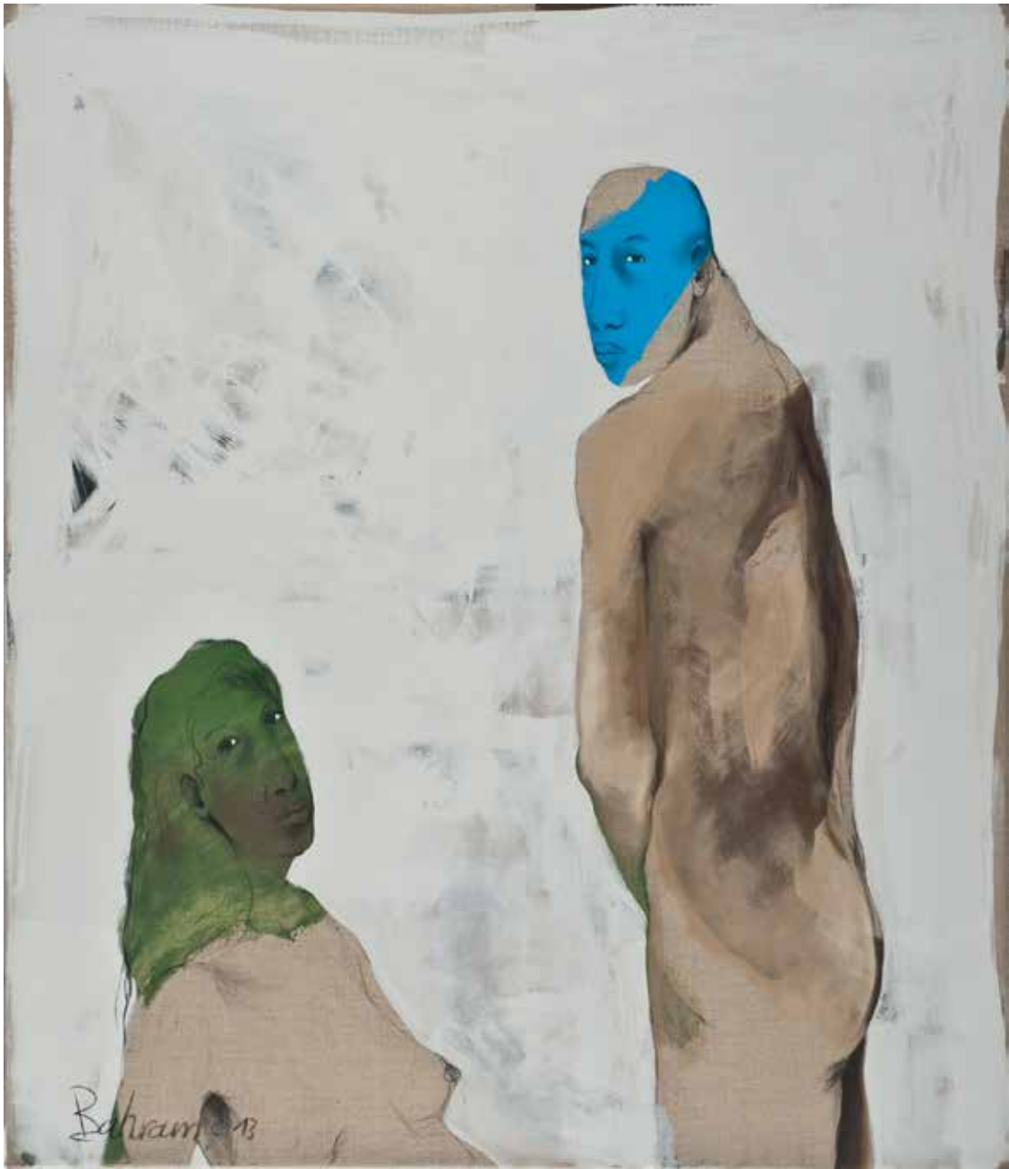
Paar | 2013 | Mixed Media/Canvas | 140 x 120 cm