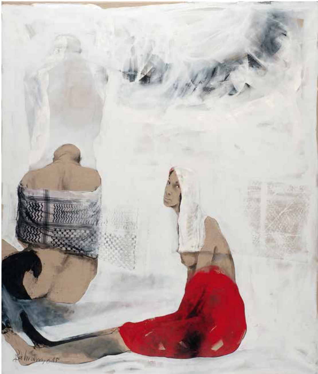
Ohne Titel | 2015/18 | Mixed Media/Canvas | 200 x 170 cm