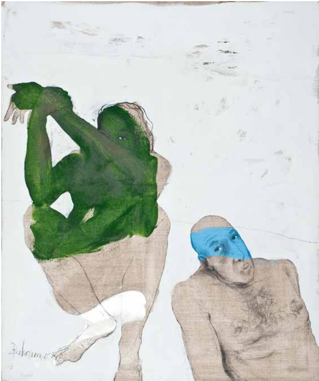
Paar | 2014 | Mixed Media/Canvas | 120 x 100 cm