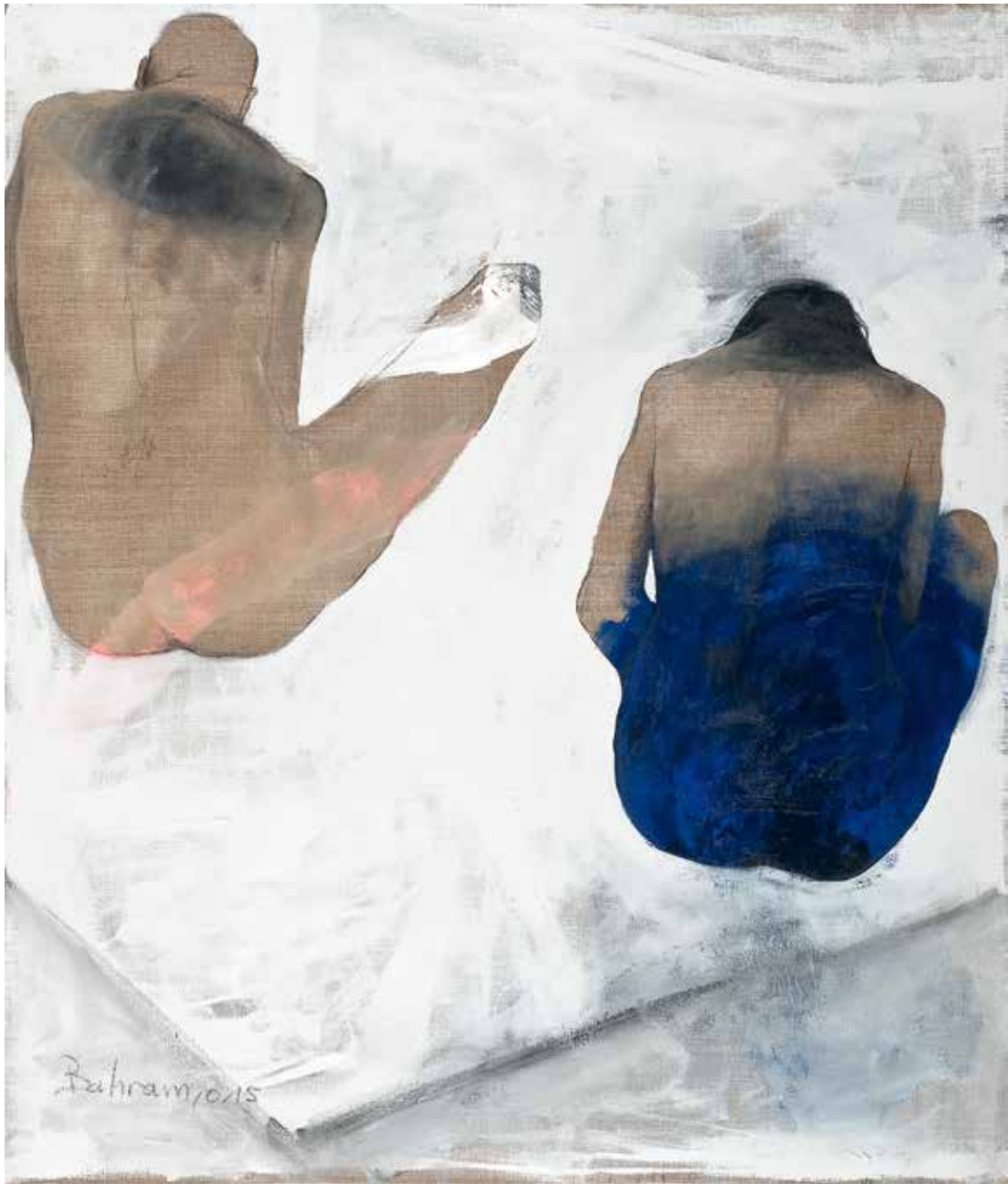
Paar | 2015 | Mixed Media/Canvas | 140 x 120 cm