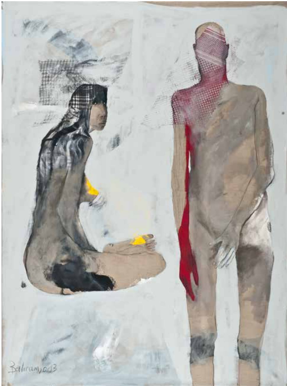
Ohne Titel | 2013 | Mixed Media/Canvas | 200 x 150 cm