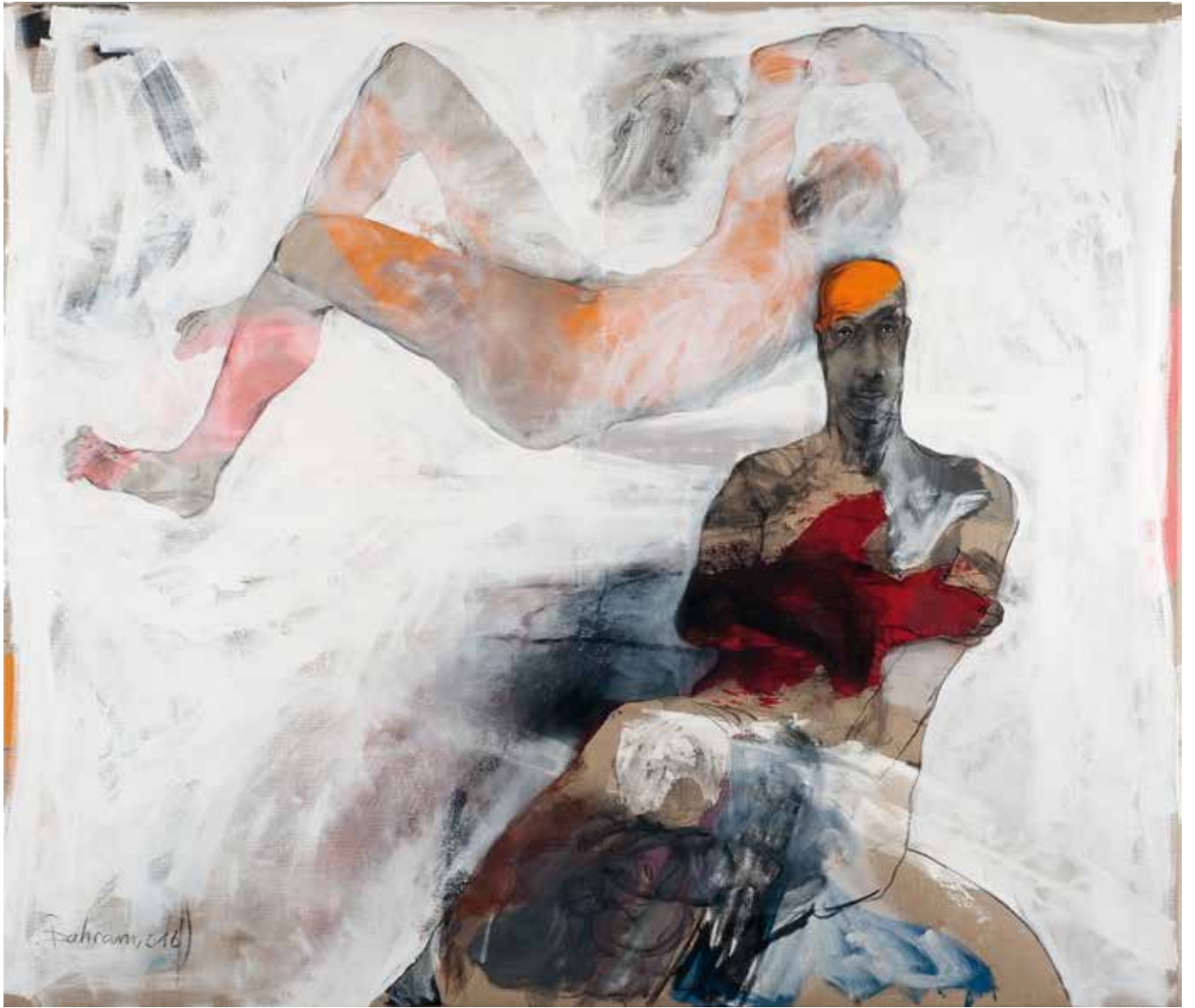
Ohne Titel | 2016 | Mixed Media/Canvas | 170 x 200 cm