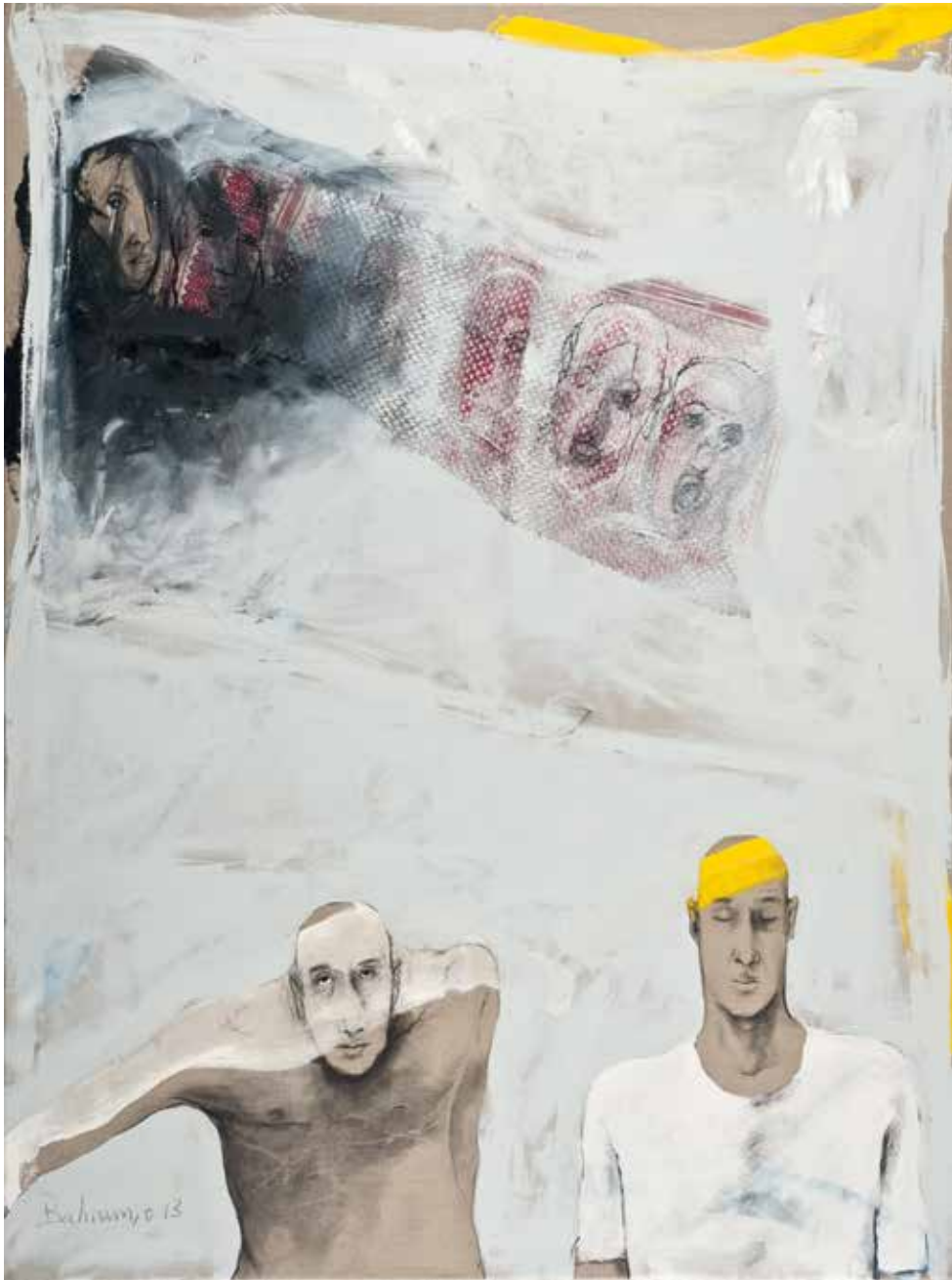
Ohne Titel | 2013 | Mixed Media/Canvas | 200 x 150 cm