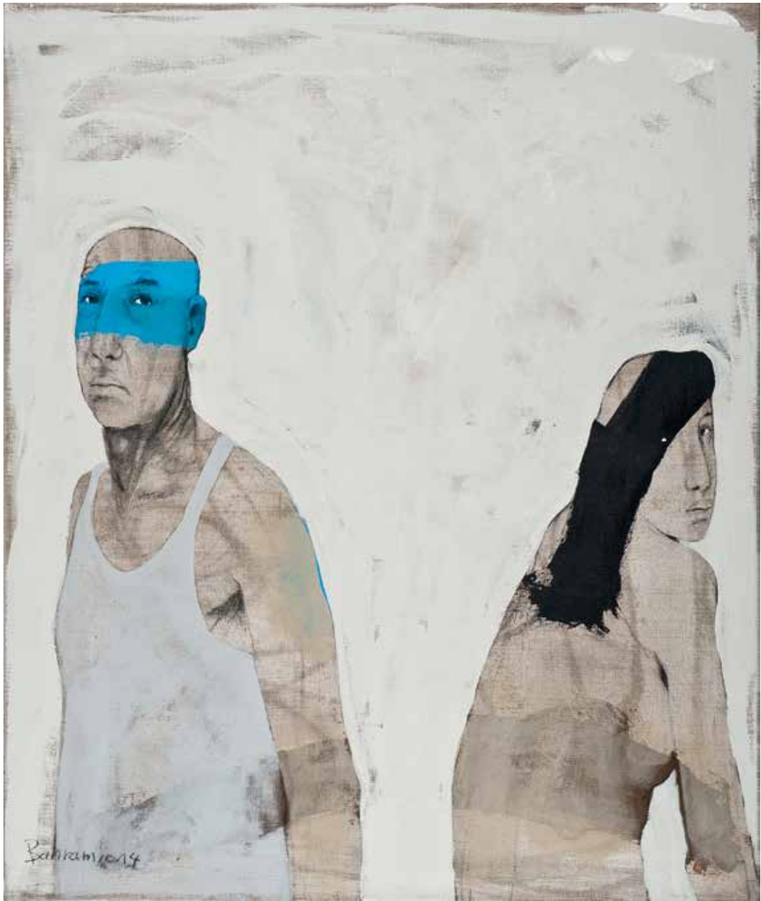
Paar | 2014 | Mixed Media/Canvas | 120 x 100 cm