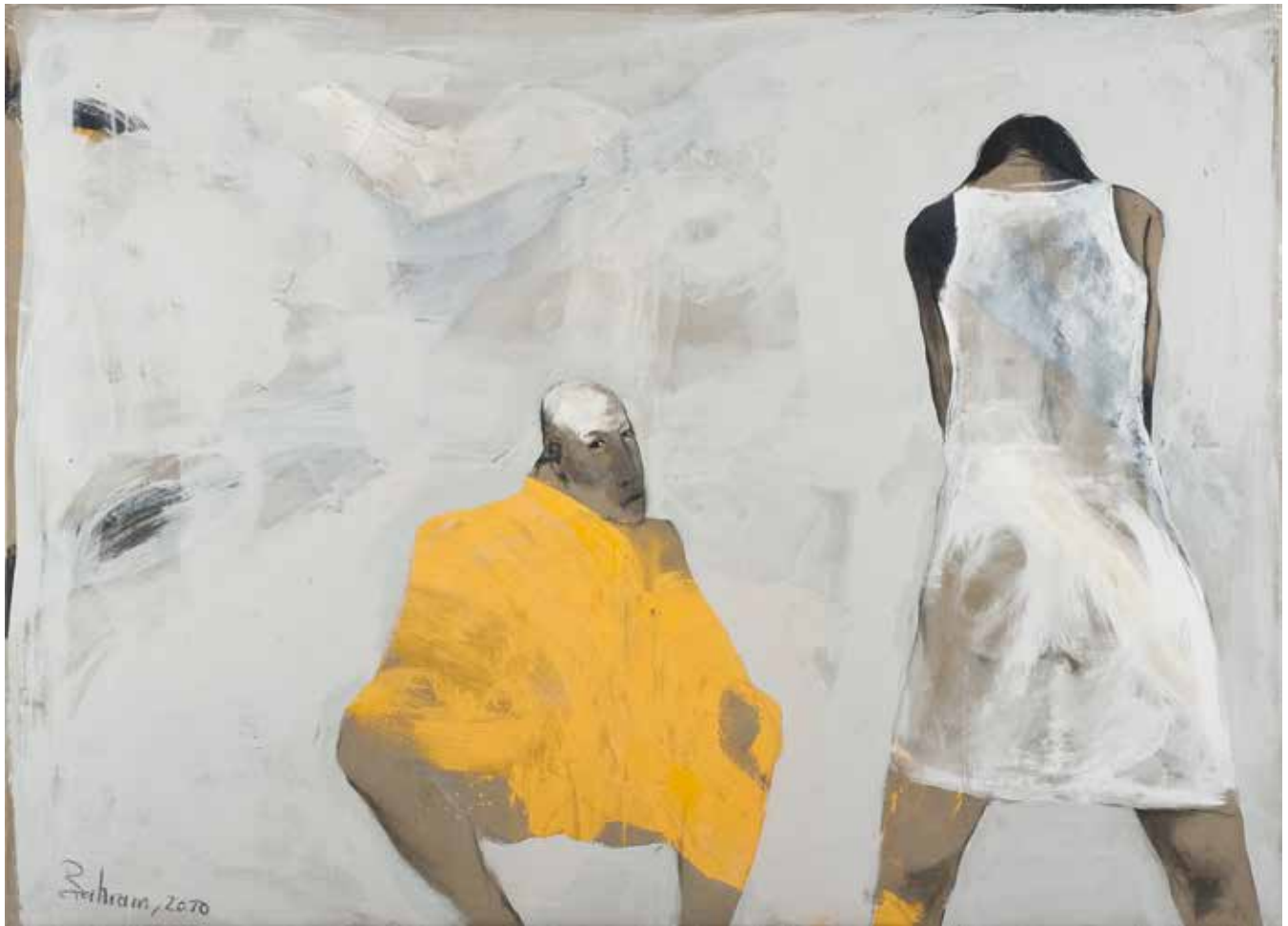
Ohne Titel | 2010 | Mixed Media/Canvas | 140 x 200 cm