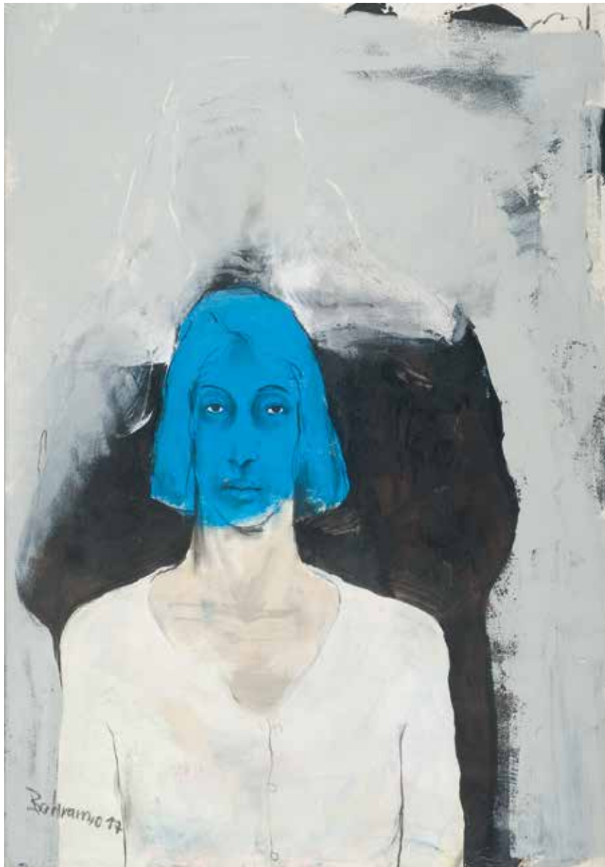
Ohne Titel | 2017 | Mixed Media/Fabriano | 100 x 70 cm