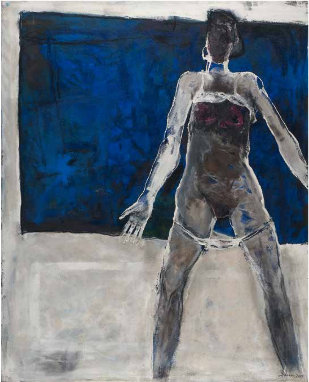
Ohne Titel | 2000 | Mixed Media/Canvas | 200 x 160 cm