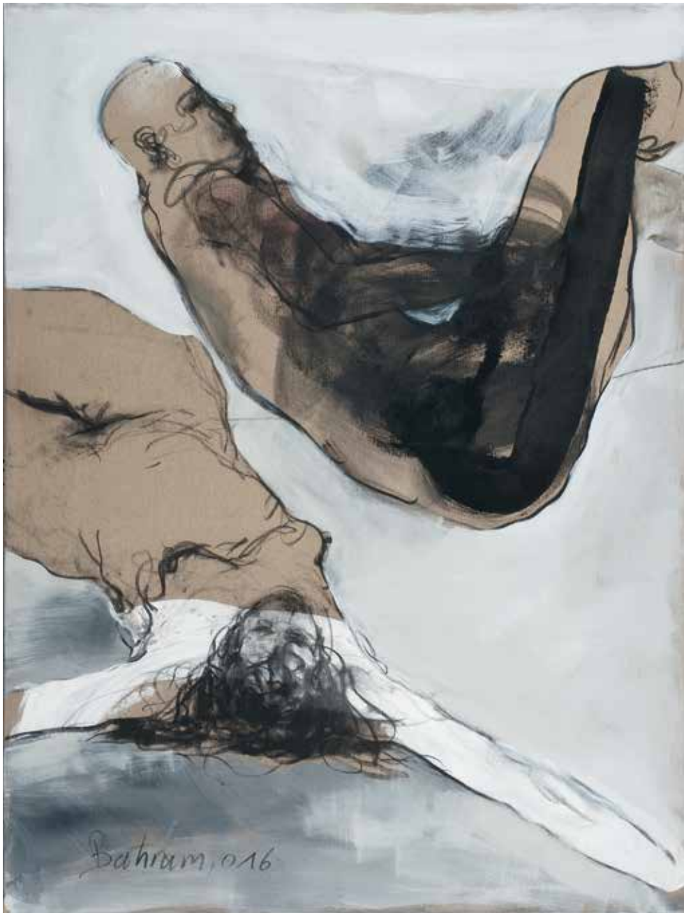
Ohne Titel | 2016 | Mixed Media/Canvas | 140 x 105 cm