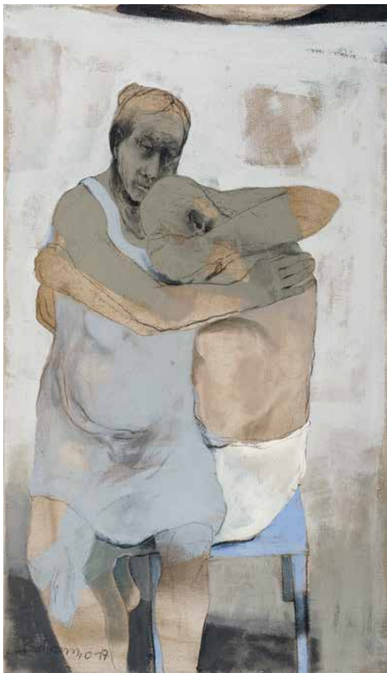
Paar | 2017 | Mixed Media/Canvas | 140 x 70 cm