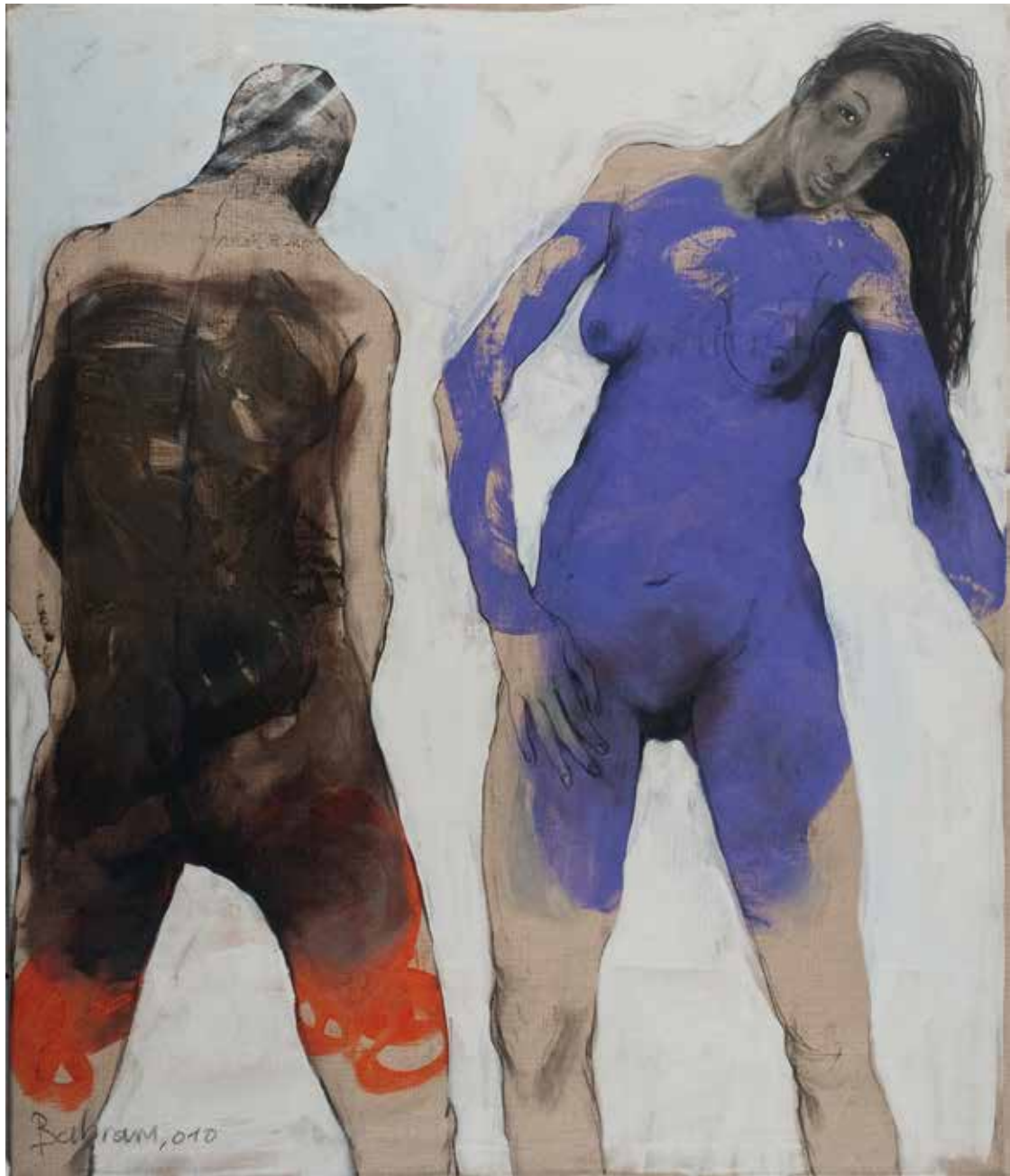
Paar | 2010 | Mixed Media/Canvas | 140 x 120 cm