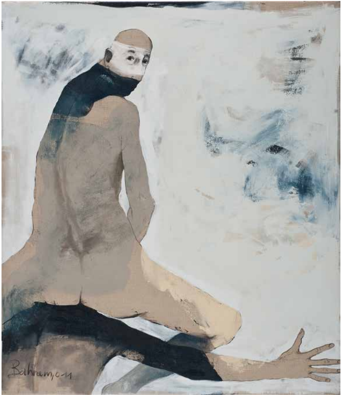
Ohne Titel | 2011 | Mixed Media/Canvas | 140 x 120 cm