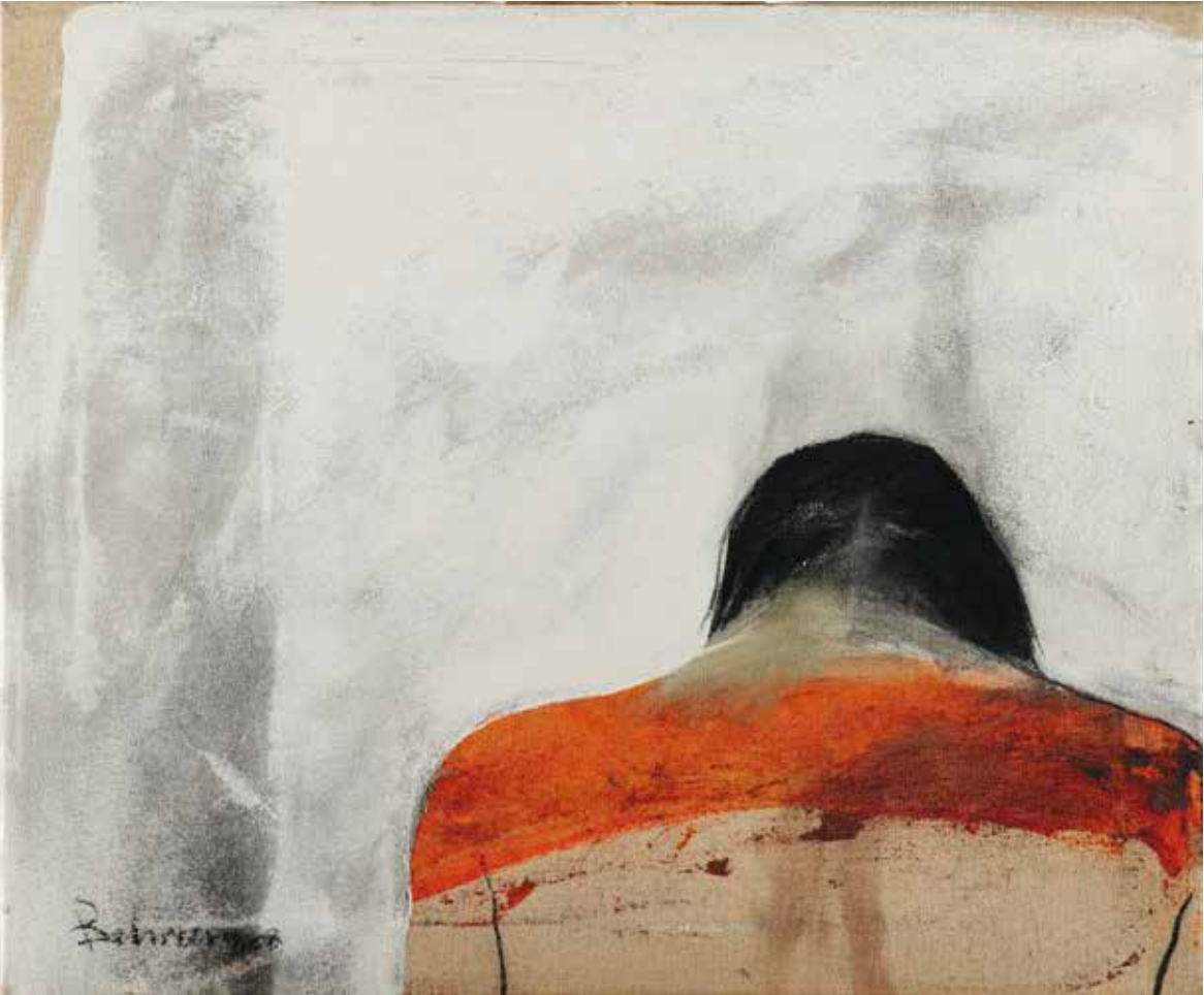
Sie | 2008 | Mixed Media/Canvas | 60 x 70 cm