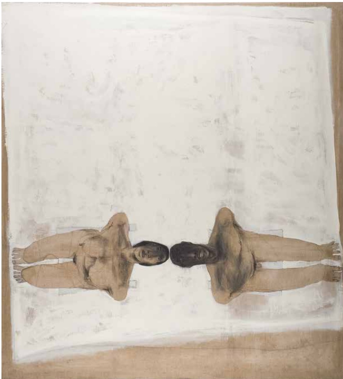
Ohne Titel | 2010 | Mixed Media/Canvas | 220 x 200 cm