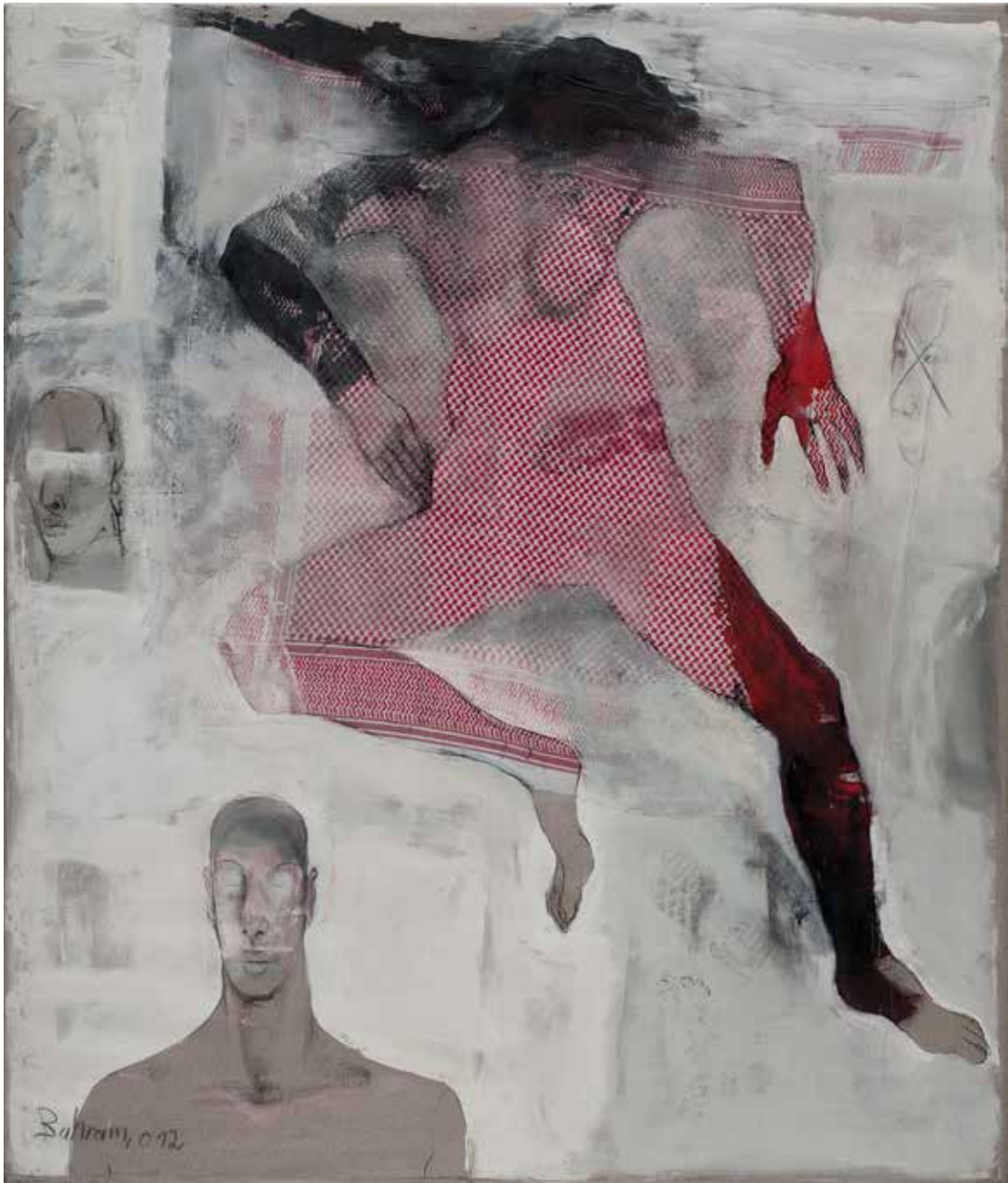
Zeugen der gegenwärtigen Gewalt | 2012 | Mixed Media/Canvas | 200 x 170 cm