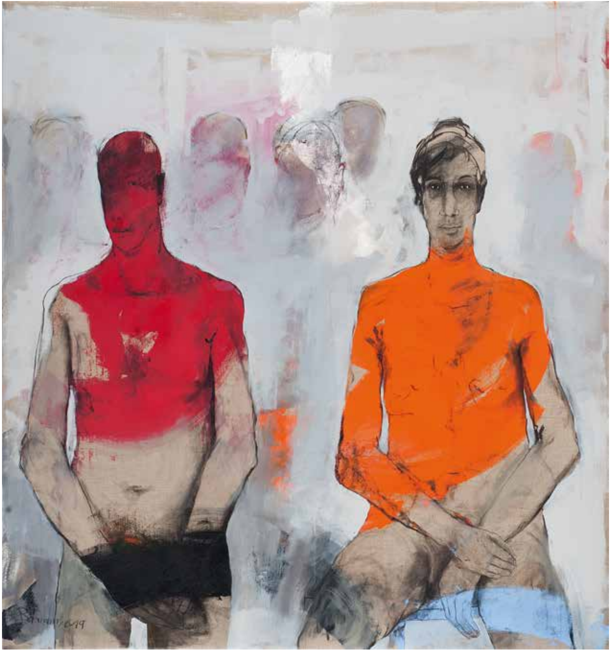
Paar | 2019 | Mixed Media/Canvas | 150 x 130 cm