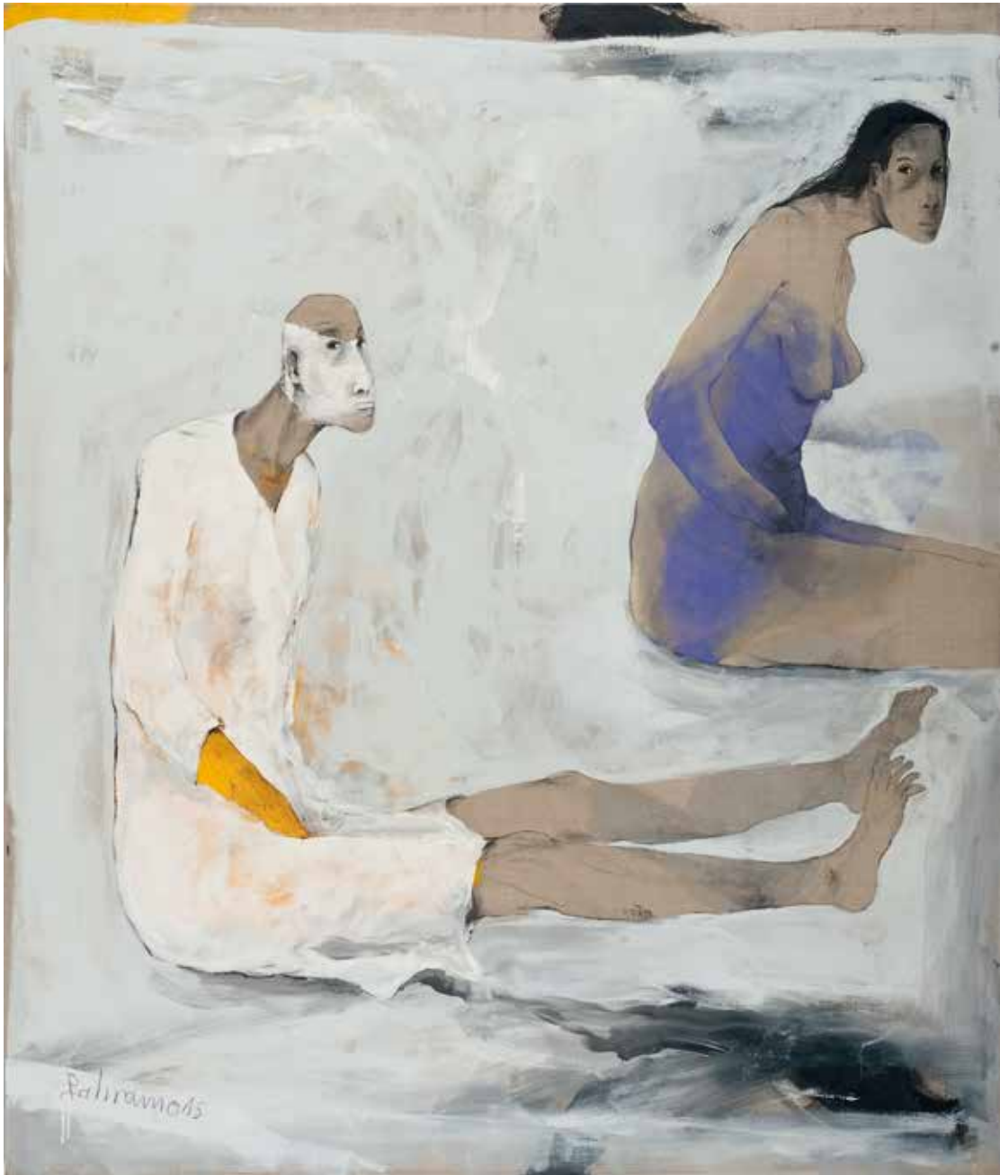
Paar | 2015 | Mixed Media/Canvas | 200 x 170 cm