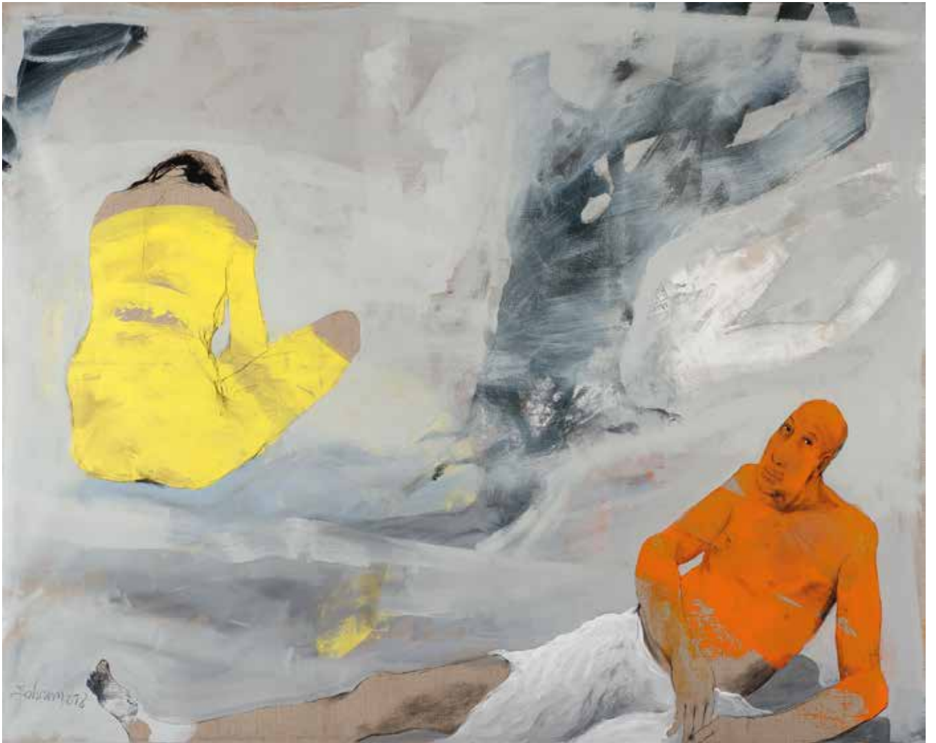
Ohne Titel | 2018 | Mixed Media/Canvas | 160 x 200 cm