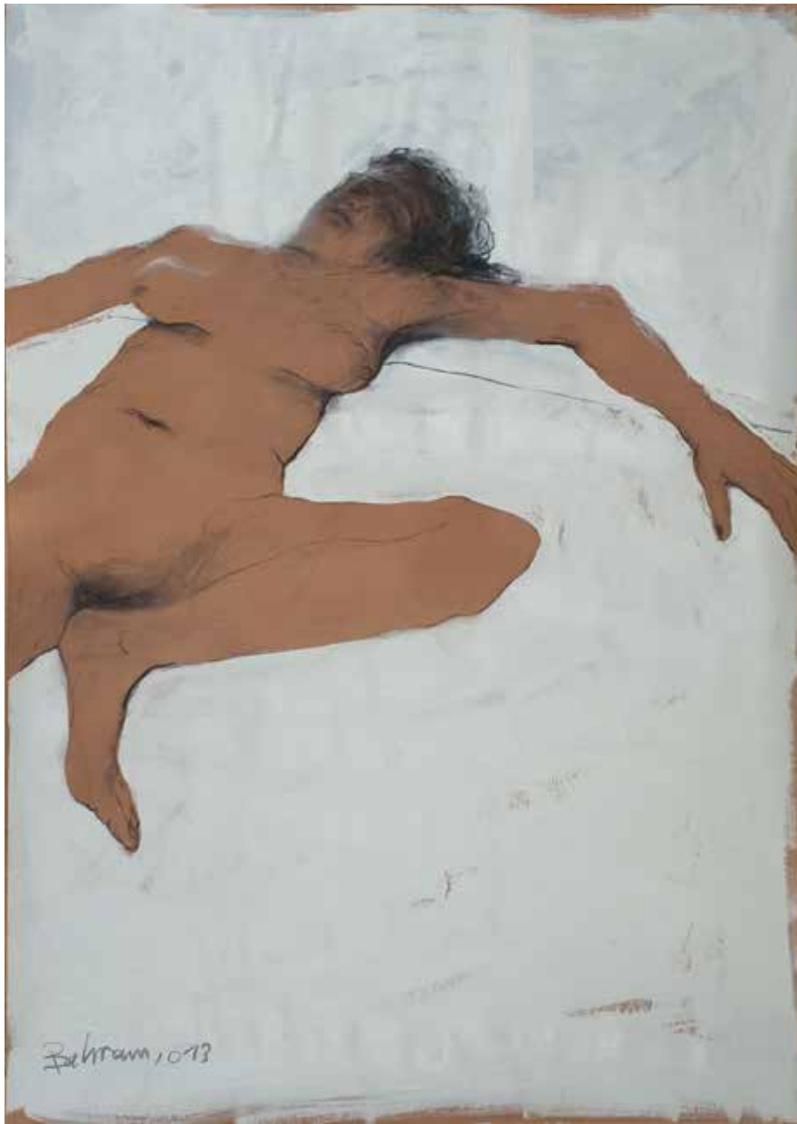
Frau | 2017 | Mixed Media/paper | 100 x 70 cm