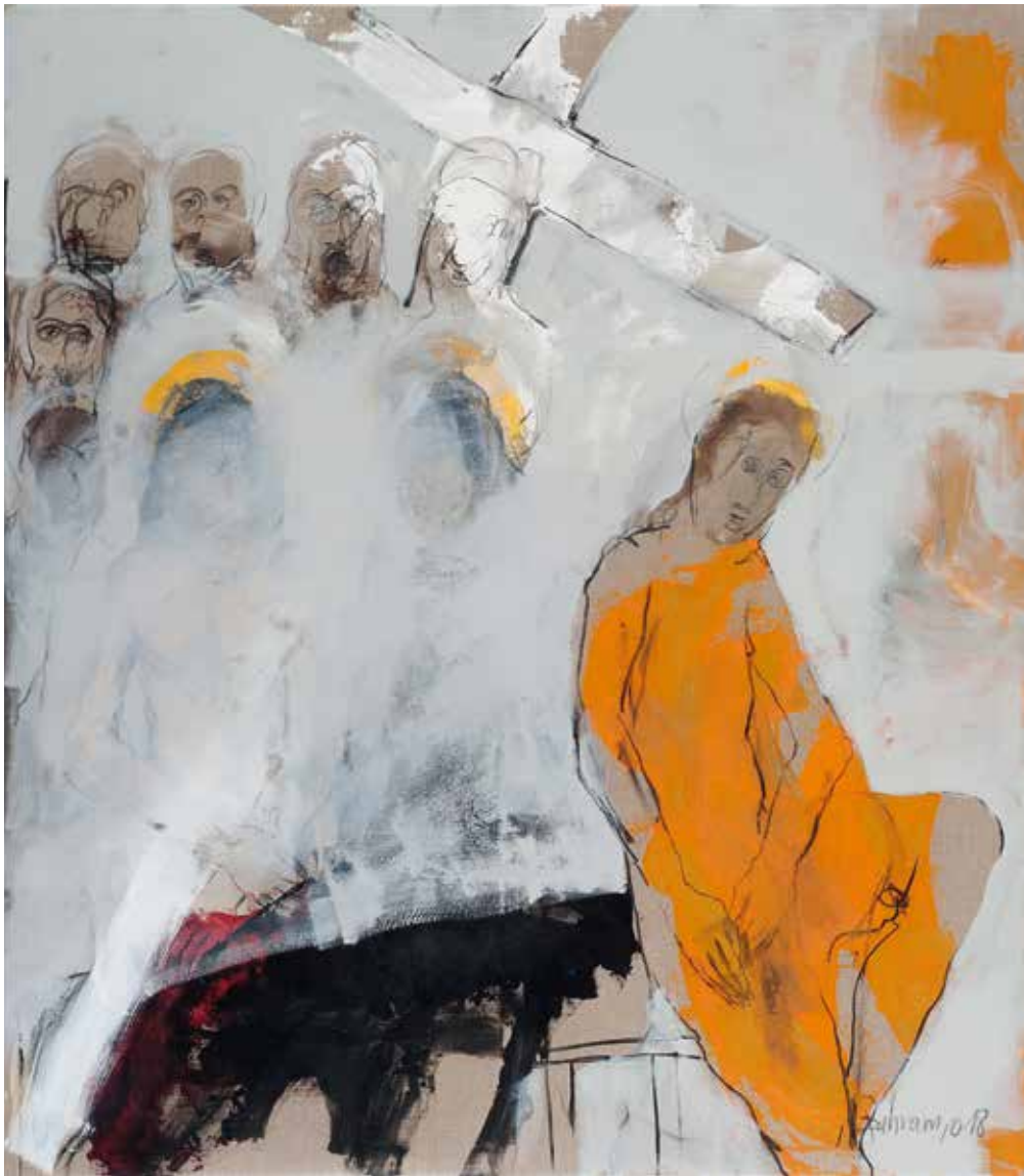
Kreuzigung III | Triptychon | 2018 | Mixed Media/Canvas 13 x 160 x 140 cm (160 x 420 cm)