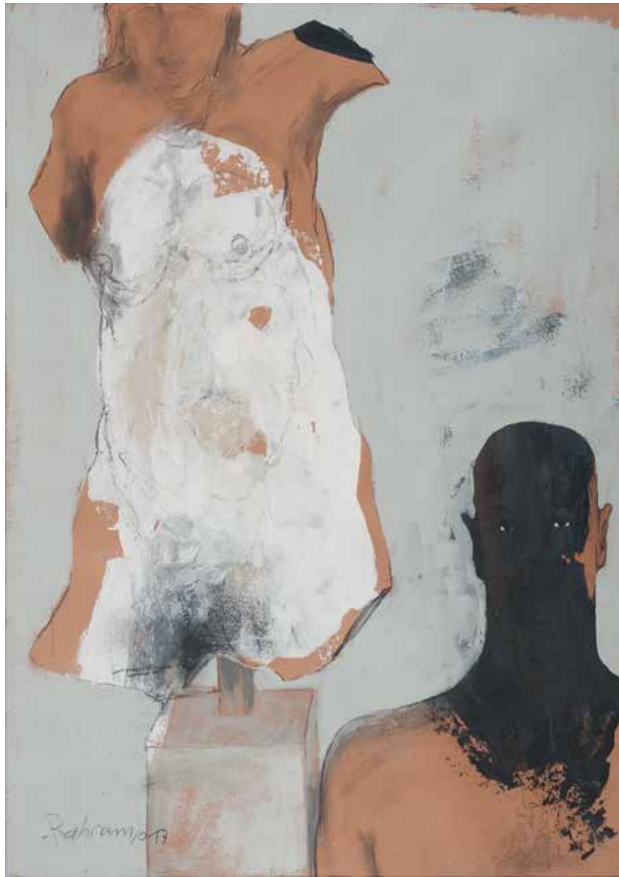
Torso | 2017 | Mixed Media/paper | 100 x 70 cm