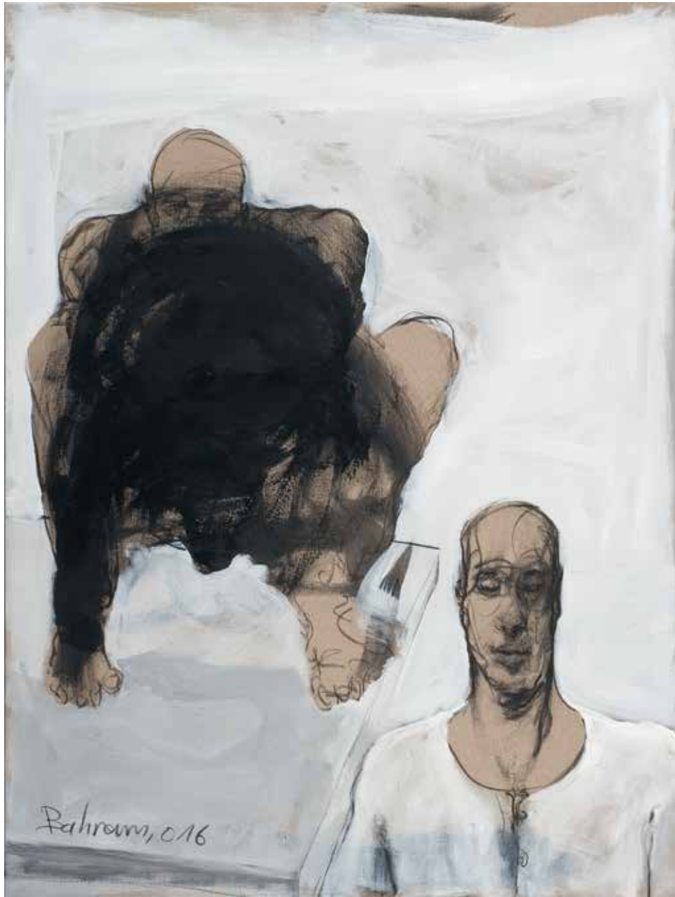
Ohne Titel | 2016 | Mixed Media/Canvas | 140 x 105 cm