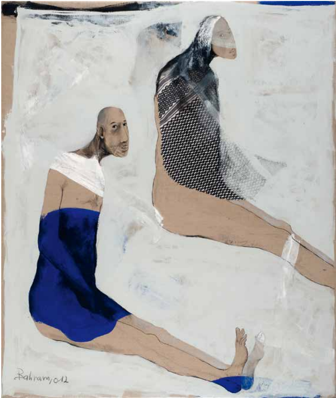
Paar | 2012 | Mixed Media/Canvas | 200 x 160 cm