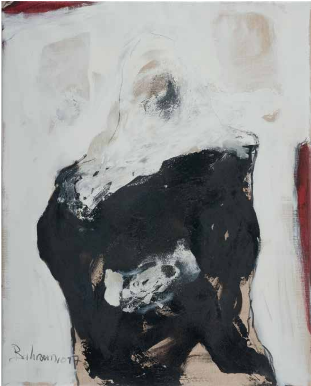
Ohne Titel | 2017 | Mixed Media/Canvas | 100 x 80 cm