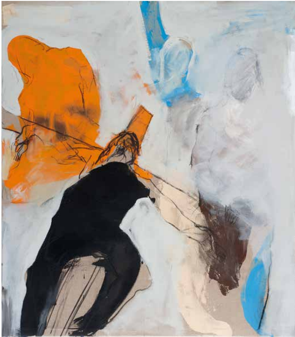
Kreuzigung I | Triptychon | 2018 | Mixed Media/Canvas 13 x 160 x 140 cm (160 x 420 cm)