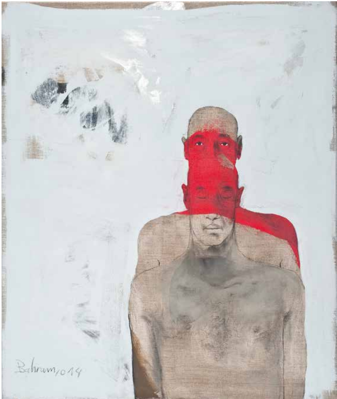
Ohne Titel | 2014 | Mixed Media/Canvas | 120 x 100 cm