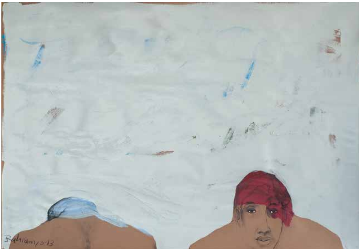
Paar | 2013 | Mixed Media/paper | 70 x 100 cm