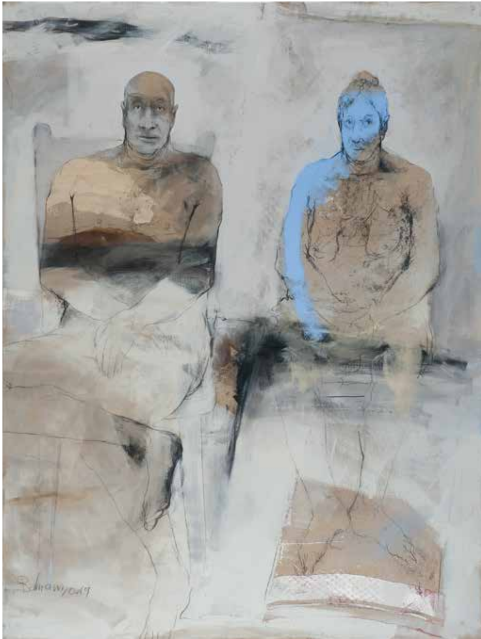
Ohne Titel | 2019 | Mixed Media/Canvas | 200 x 150 cm