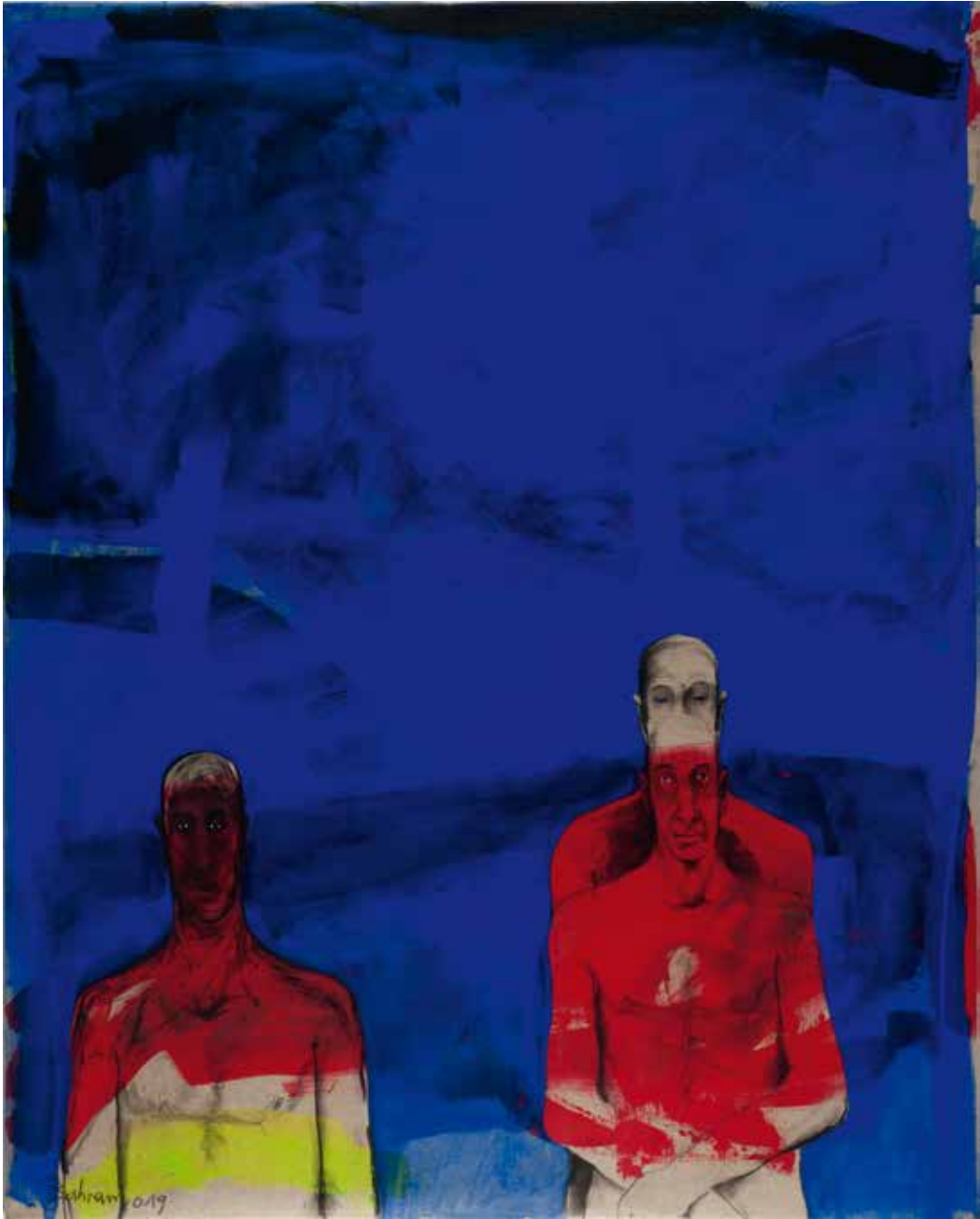
Ohne Titel | 2019 | Mixed Media/Canvas | 200 x 160 cm