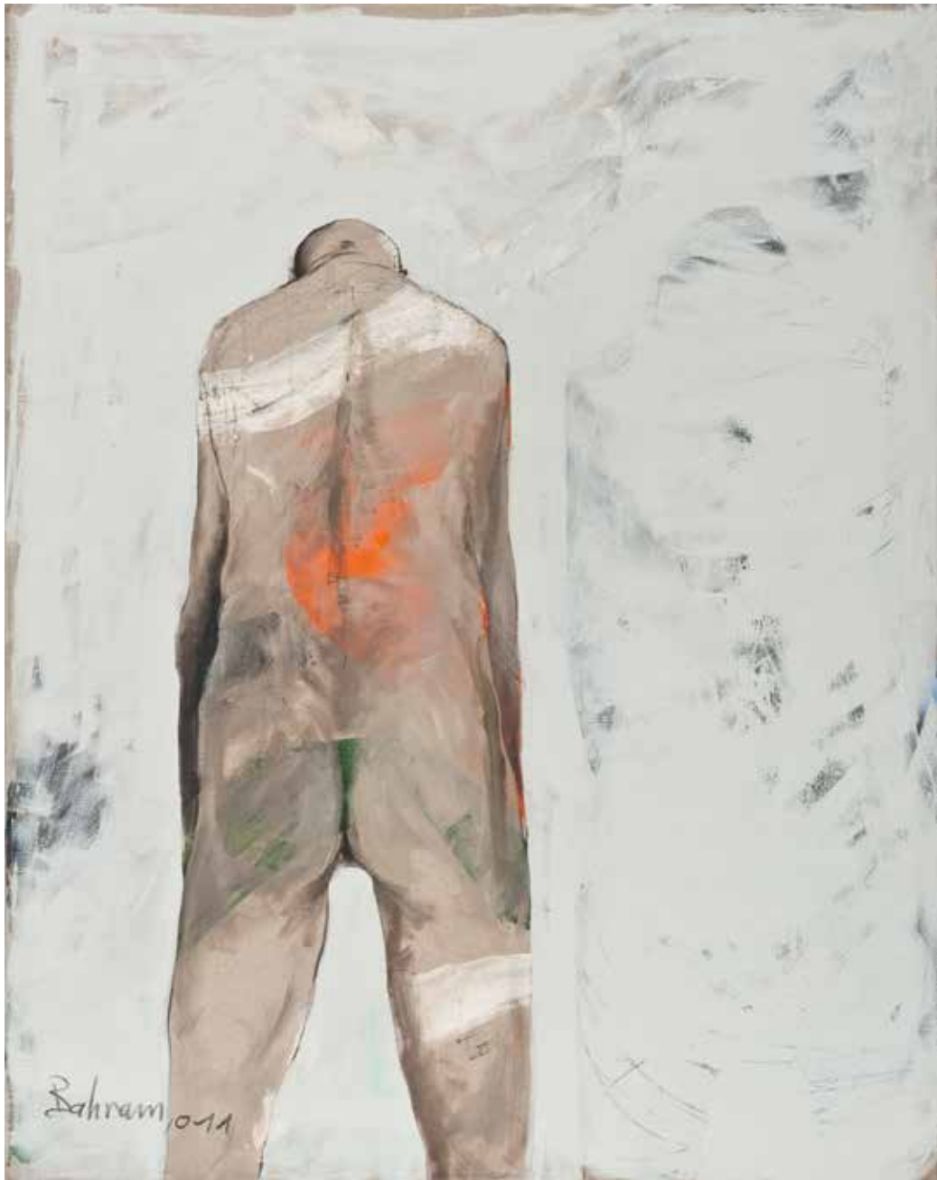
Ohne Titel | 2011 | Mixed Media/Canvas | 150 x 120 cm