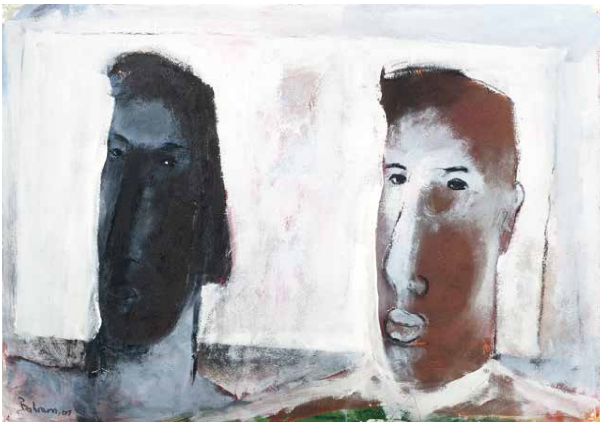
Paar | 2017 | Mixed Media/paper | 70 x 100 cm