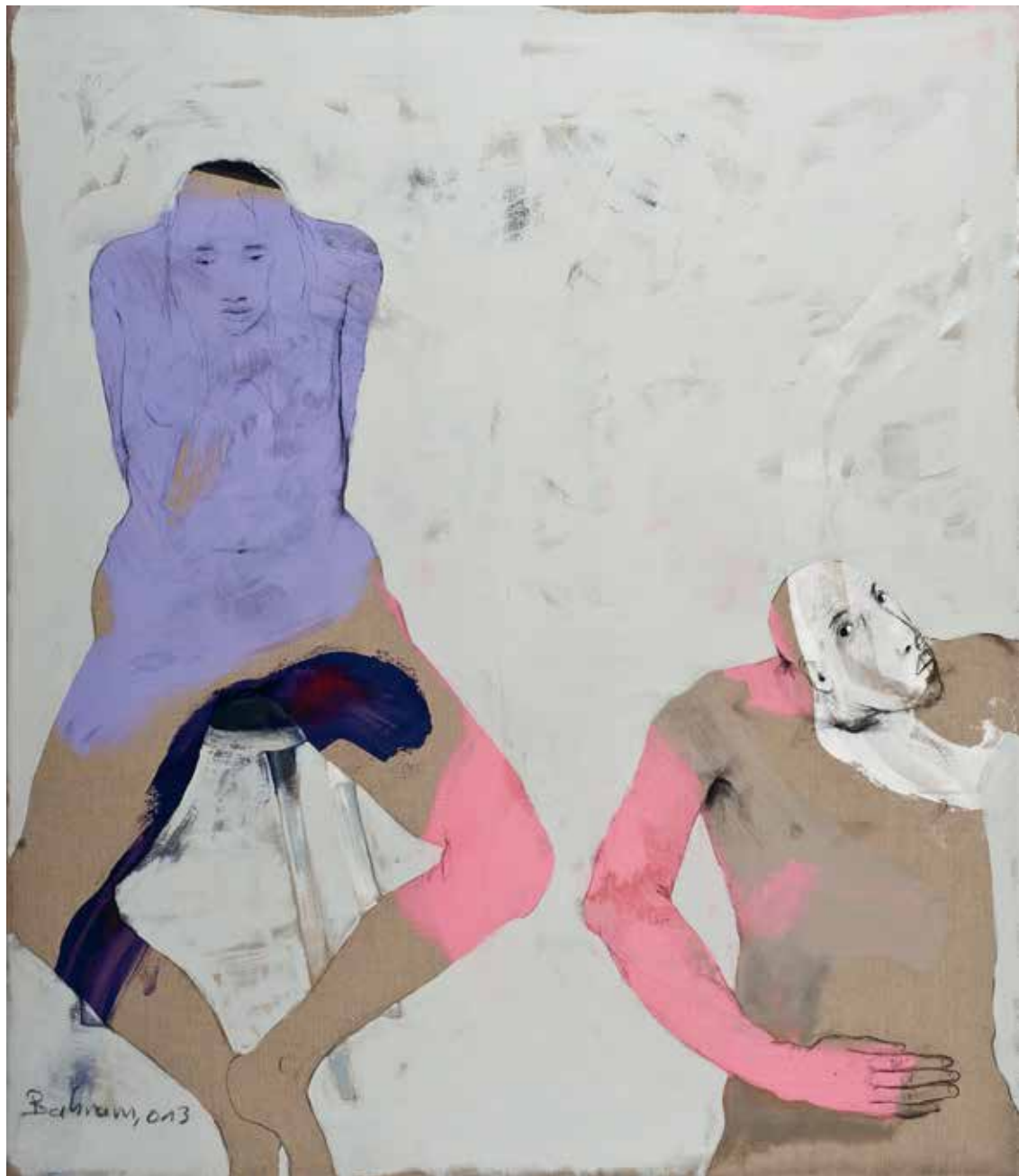
Ohne Titel | 2013 | Mixed Media/Canvas | 160 x 130 cm