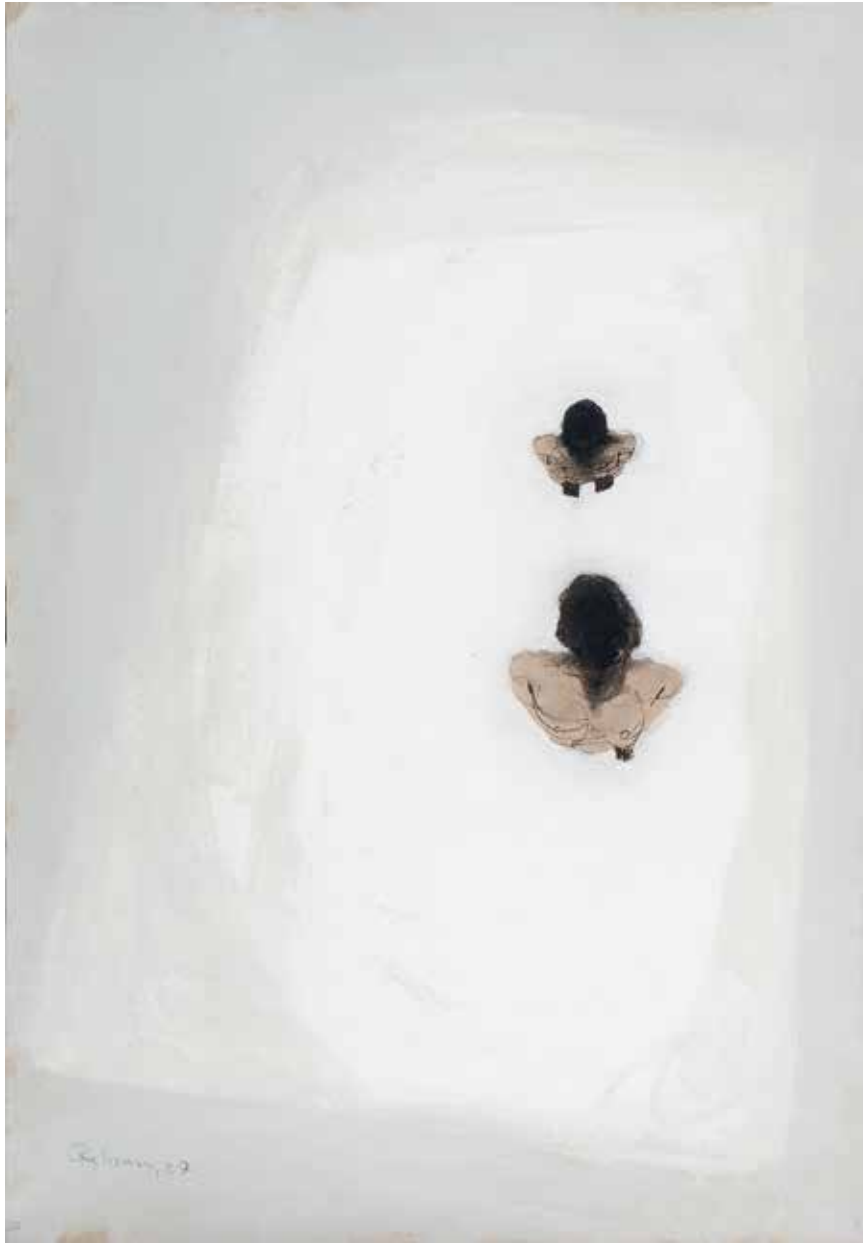
Ohne Titel | 2007 | Mixed Media/paper | 100 x 70 cm