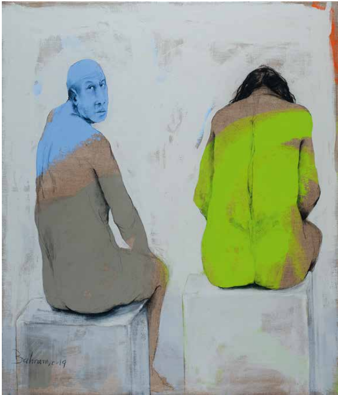
Ohne Titel | 2019 | Mixed Media/Canvas | 140 x 120 cm