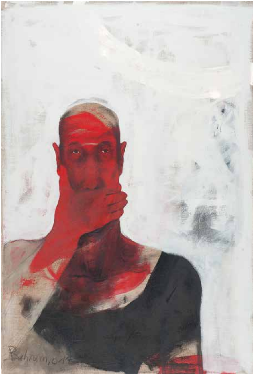
Ohne Titel | 2017 | Mixed Media/Canvas | 140 x 95 cm