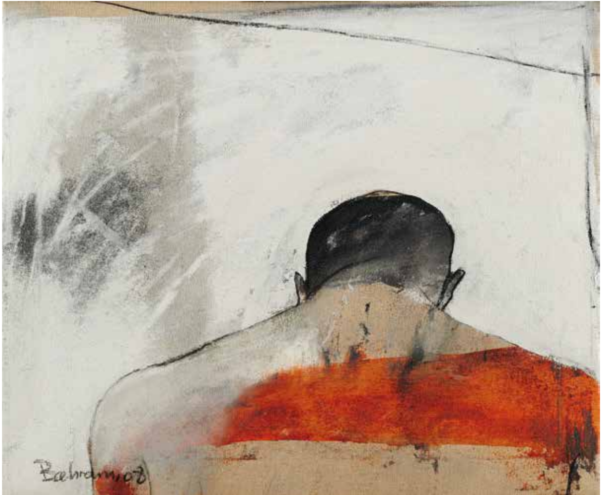
Er | 2008 | Mixed Media/Canvas | 60 x 70 cm