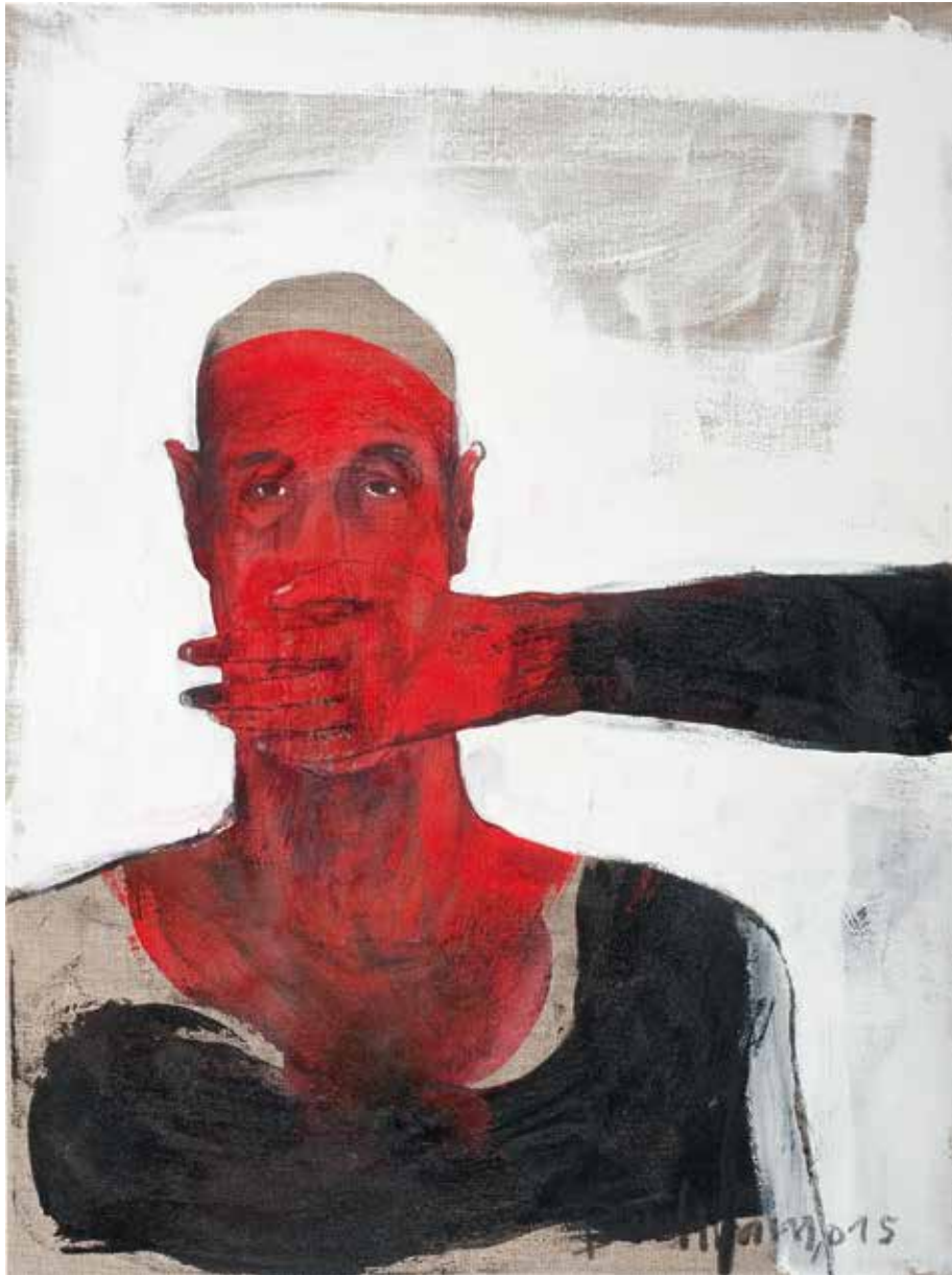
Ohne Titel | 2015 | Mixed Media/Canvas | 80 x 60 cm