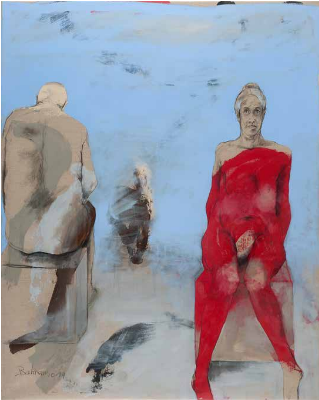
Ohne Titel | 2019 | Mixed Media/Canvas | 200 x 160 cm