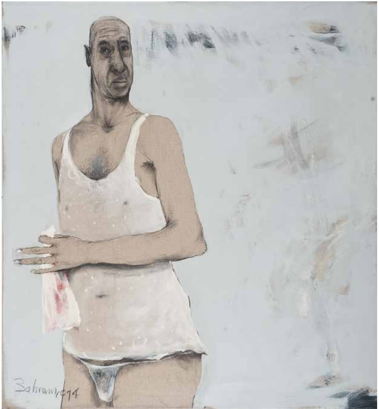
Mann | 2013/14 | Mixed Media/Canvas | 120 x 110 cm