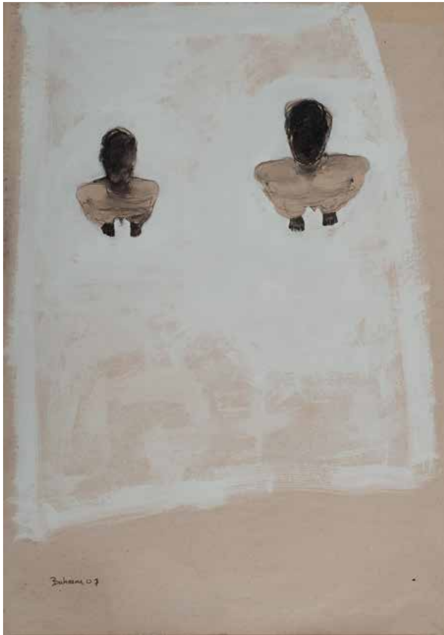
Ohne Titel | 2007 | Mixed Media/paper | 100 x 70 cm